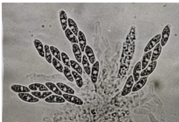
圖1. 葡萄晚腐病菌 ( Glomerella cingulata ) 的子囊及子囊孢子。

菌及擔子菌之無性繁殖時期；另一類為不具雙核時期之真菌，包含芽枝黴門 (Blastocladiomycota)、 壺菌門 (Chytridiomycota)、 新麗鞭毛菌門 (Neocallimastiomycota)、 囊黴菌門 (Glomeromycota)、 接合菌門 (Zygomycota)、 及微孢子蟲門 (Microsporidia) (Blackwell et al., 2012)，其中芽枝黴門、壺菌門、及新麗鞭毛菌門會產生孢子囊 (sporangia) 及游走孢子 (zoospores)，囊黴菌門即為內生菌根真菌，接合菌門會產生孢子囊及孢囊孢子，微孢子蟲門為單細胞之絕對寄生菌，寄主主要為節肢動物，此類菌早期被視為原生動物。