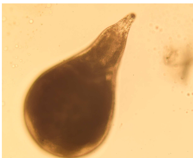
圖3. 番茄之根瘤線蟲( Meloidogyne incognita )的雌成蟲。

蟲的移動起初並無特定目標，直到它靠近寄主根部並受到根部分泌物之誘引，乃趨向其根尖。二齡幼蟲以口針刺入寄主植物細胞並鑽入根部組織而定著，並開始攝取根細胞的養份。蟲體在植物根組織內，將食道腺產生的分泌物由口針注入植物細胞，促使維管束細胞膨大且加速其中柱鞘(pericycle)細胞分裂，形成合包體(syncytia)，最後細胞不斷分裂膨大而成巨形囊狀物。母蟲食道腺較發達，利於其攝食，雄蟲則否。而每一根瘤是由一隻母根瘤線蟲及其所產卵塊所構成。雄成蟲則鑽出根部逸入土中。根瘤線蟲的生殖方式為孤雌生殖，以有絲分裂方式產生雙套染色體的卵。精子(單套染色體)對卵的發育非必要，亦無受精作用。但兩性生殖亦見於某些種的根瘤線蟲族群(Taylor and Sasser, 1978)。