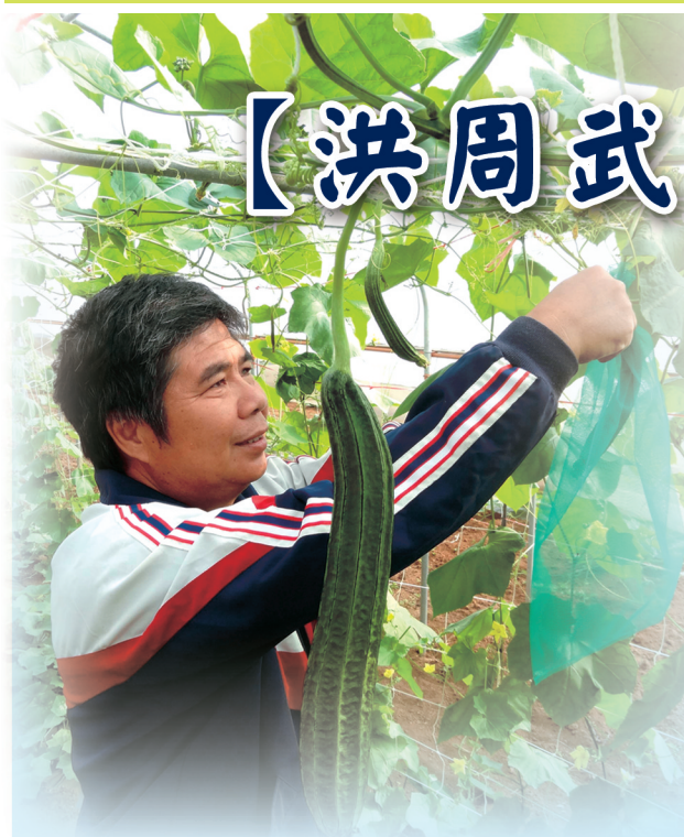
套袋防止瓜實蠅的危害

離島農業受制於自然環境的影響，其規模雖不如臺灣本島大，但仍有一群「骨力做」的農民默默的在耕耘，不論是栽培技術或經營管理的觀念都不落人後，不只讓當地民眾能吃到健康及營養，也讓遊客開始喜歡上當地農產品，有的更是跨海訂購。