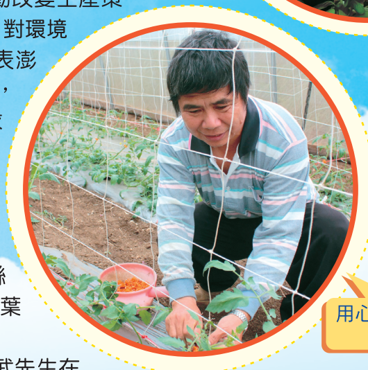
用心牽引小果番茄的整枝工作