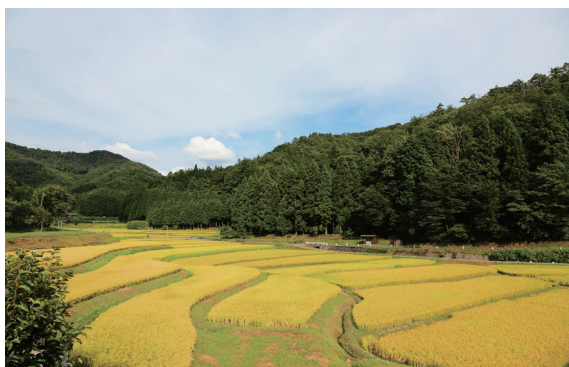
▲里山指涉的是森林與城鎮之間的緩衝區亦即淺山生態系。

回頭省思台灣的現況，農村在全球化的腳步與都市發展蔓延的侵吞下，許多重要的文化傳承、生活智慧與生態環境，早已隨之煙消