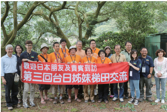
▲八煙與英田上山棚田團的交流已邁入第三個年頭