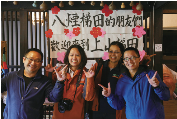
▲生態工法發展基金會拜會日本姊妹梯田英田上山棚田團受到當地朋友熱烈的歡迎

沒有大規模機械化耕作的農耕時代，人類與大自然互動所形塑的「社會生態生產地景」（Socio-ecological Production Landscape）；反思過去老祖宗尊天敬地的生活智慧，回歸人類與大自然的和諧關係。台灣在經濟泡沫化，許多都市漂鳥願意大批回歸農村的同時，我們是否也該認真思考，應透過什麼樣的機制，讓傳統農村的技術傳承、生活智慧、老年照護與生態環境可以回歸我們對桃花源的想像，讓有機農村遍地開花，形成台灣生態的重要網絡。聯合國「里山倡議」所揭櫫的共生願景及三種做法，似乎是一帖讓我們可以重新思考土地倫理與產業價值的良方。