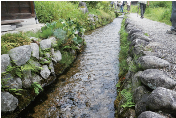
▲水是所有生命的源頭日本的里山案例中乾淨的水源扮演著重要的關鍵角色