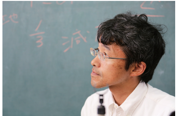
▲推動半農半 X 倡議的塩見直紀先生

台灣近年來也逐漸面對老年化社會的壓力，全球分工下，產業的出走與凋敝，逐漸升高的失業率以及年輕人鮭魚回鄉無法立足的困境。未來，農村也許是台灣經濟與社會復興的所在，在新的時代，人究竟要如何與自然互動，如何思考新的依存關係，確認「可持續發展」的商業模式，才是未來「里山台灣」的發展關鍵。