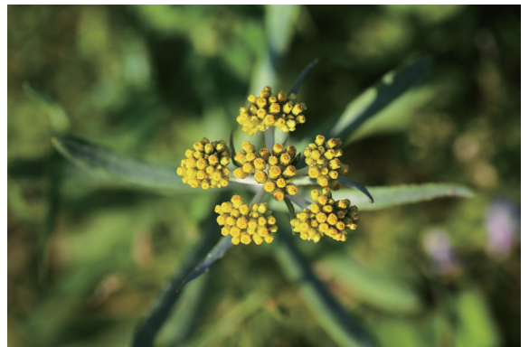
▲台日梯田春天在田埂都會出現的美麗鼠麴草

造化就是這般弄人，豐里西小學校曾經是塩見直紀所就讀的小學，但歷經年輕人口外移與少子化的時代洗禮，仍被迫於 1999 年 3 月關閉，當塩見放棄都市生活回到故鄉的同時，面對人口的老化、良田的廢耕、甚至學校的關