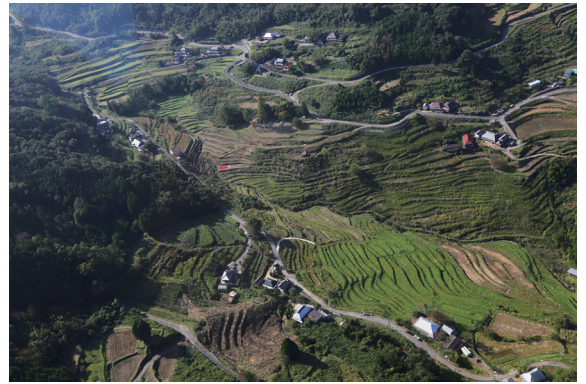
▲美作市上山梯田空拍紅心為環境藝術

2012年基金會有興與日本農業12傑的岡山縣美作市英田上山棚田團結姊妹梯田，透過每年兩度的雙方互訪，更深刻的體認了日本農業的現況與戮力實踐的深耕，該年9月份更透過林務局里山案例的參訪，更有全面性的視野，見識到了日本民間的韌性以及政府的遠