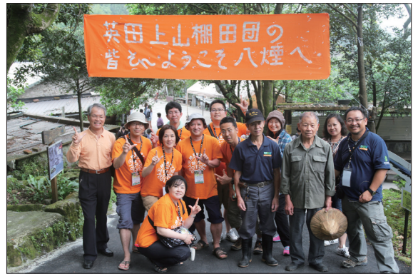
▲英田上山棚田團的朋友三度拜訪八煙聚落並締結姊妹梯田

見，這一次的行程走訪了包括龍谷大學里山學研究所、綾部市里山交流研究中心、福知山市的毛原梯田、NHK里山紀錄片的拍攝場景：高島市針江生水之鄉、福井縣敦賀市「中池見」拉姆薩公約的國際級濕地、滋賀縣的近江八幡水鄉守護會，以及滋賀縣東近江市的「河畔生物森林中心」等，日本中部幾個主要的農業生產案例與自然教育中心；透過林務局與台北大學的細心安排，讓我們對日本農村當前的現況以及自然教育中心的操作，有了更深刻的對談與交流，其中尤以塩見直紀先生所倡議的「半