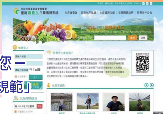
▲ 圖1 臺灣農產品生產追溯系統網站首頁 (網址 https://qrc.afa.gov.tw )

爾來食品安全問題頻傳，舉凡飲料、餐點及調味品等危害情形屢見不鮮，導致消費者人心惶惶，影響的層面已經擴大到日常生活中，心中不免懷疑到底我們每天吃的食品是否安全？有沒有辦法追溯到農產品上游供應端等問題。