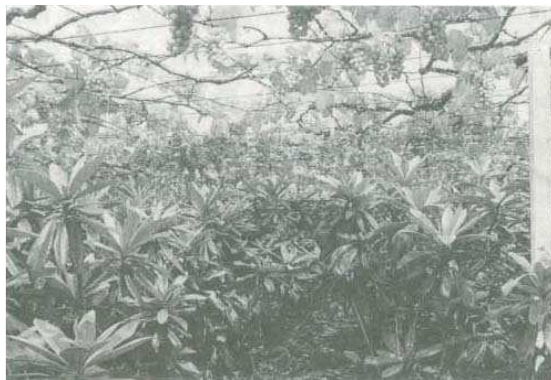
圖1 葡萄棚架下種植枇杷

在葡萄棚架下種植枇杷，兩種果樹混植，其生育期之田間作業，有部份工作可同時進行（圖1及圖2）。在4月間枇杷採收結束後，進行修剪與促進新梢生長，葡萄則進入開花結果期，5~6月間促進枇杷新梢生長與葡萄幼果期之施肥及其他果園管理作業相似。7~9月葡萄採收後至冬果萌芽期間，葉片較稀少，約有2~3個月之日照充足期間，有利於枇杷新梢停心與花芽形成。10~12月為葡萄果實生長期與枇杷開花結果期，二者之肥培管理相似，若慎選病蟲害防治藥劑以免藥害，則不會影響枇杷之開花結果。12月~1月間葡萄採收後，受到寒流影響自然落葉休眠，枇杷進入果實生長中後期，日照條件良好，不會影響枇杷果實之肥大與成熟。