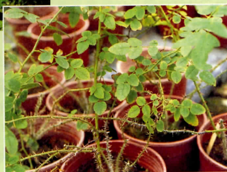
→香葉薔薇特殊之處在於它的葉片具有蘋果芳香。

薔薇、玫瑰和月季三種，它們的差別是薔薇為多花性，由較多小花聚成有分枝的圓錐花序，葉片平滑，薔薇原意為牆薇，是指枝條柔軟細長倚牆才能直立生長之意。玫瑰是指花較大，花數較少，葉片有皺紋的種類，因為花謝後結成大而圓的果實，好像紅色的玉故稱為玫瑰。薔薇和玫瑰開花期均在初夏，每年只開一次花，而月季則是指那些可以整年持續逐月開花的品種，這個特性被育種者拿來作為品種改良的親本，造就了今日超過一萬以上的栽培種，統稱為現代玫瑰，也因為如此薔薇、玫瑰、月季的差別也越來越不清楚。現代玫瑰多具有花大而美及四季開花的特性，但花香氣反而沒有那麼濃郁，因此以玫瑰花瓣抽取精油的種類，還是以那些產於歐洲及西亞的原生種或其相互雜交種為主。在現代香草植物的應用上，包括食用花瓣及泡製香草茶的品種有：