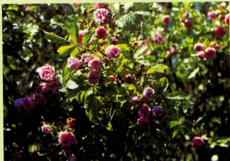
↑百瓣薔薇以其花瓣多半開狀而得名。