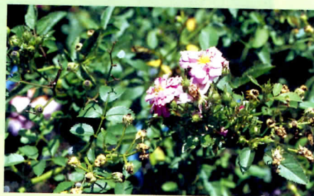
↑天使薔薇就是月季花，市面沖泡花草茶用的玫瑰乾燥小花蕾大多屬於本種。