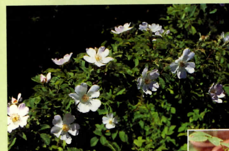
↑在歐美地區隨處可見的犬薔薇以食用紅熟果實為主。