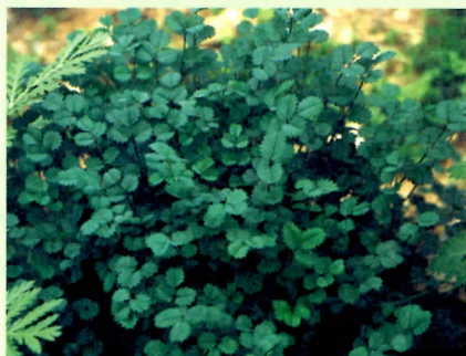
↑小地榆葉片較小，富含小黃瓜的香氣。