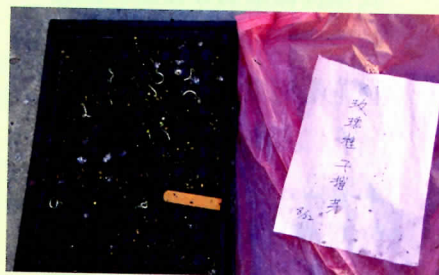
↑玫瑰種子要低溫層積處理才會發芽。