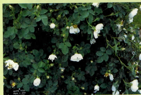
↑白薔薇是所有古典玫瑰中最健壯且容易栽培的種類。