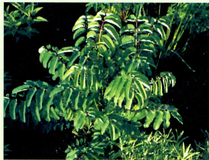
↑地榆葉片較大，以藥用為栽培目的。

5 公分，葉緣呈細鋸齒狀。一般而言，本屬在臺灣平地於冬天時較適合生長，其中地榆在夏天時生育雖差但還不