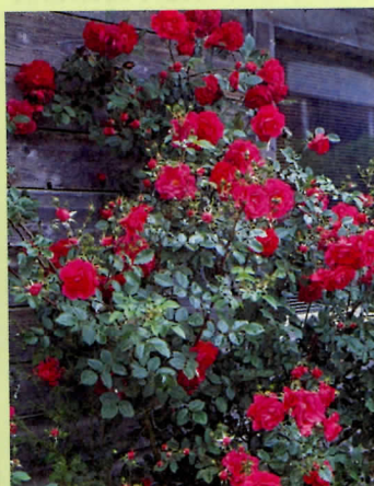
↑大馬士革薔薇可萃取出高品質的玫瑰精油。