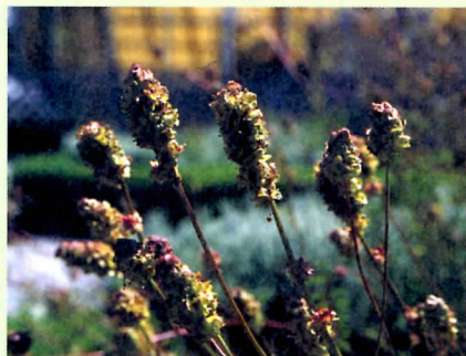
↑地榆的花序構造呈圓球形，小花密生於上，無花瓣。