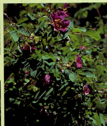
↑法國薔薇是古典玫瑰中最早被培育出來的種類。