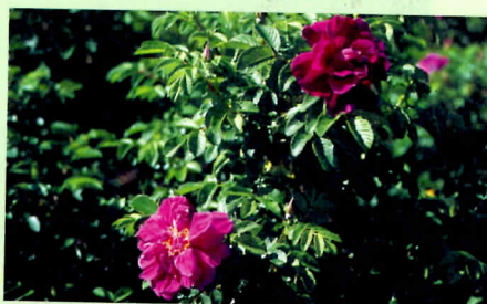
↑皺葉薔薇就是我國最早稱為玫瑰的種類。