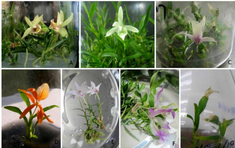
圖 1、不同種的石斛瓶內開花 (A-F) 及結果莢 (G) 的情形。a.鐵皮石斛 ( D. officinale )；b.霍山石斛 ( D. huoshanense )；c.天宮石斛 ( D. aphyllum )；d.獨角石斛 ( D. unicum )；e.始興石斛 ( D. Shixingense )；f. D. Shixingense X D. crystallinum 。(Silva et al. , 2014)