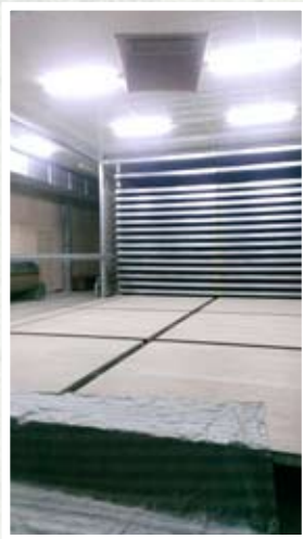
圖五、寬敞明亮的製茶廠