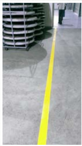
圖四、製茶動線規劃妥善