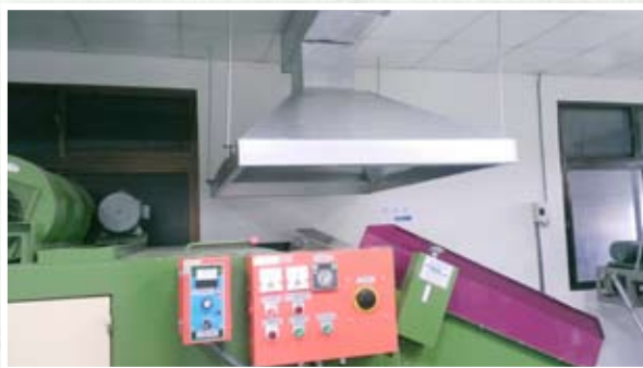
圖三、乾燥室的集塵設備