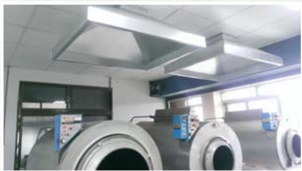
圖二、炒菁室的集塵設備

備(圖二、圖三)，以免從業員吸入過多的茶毛與塵埃影響健康；規劃得宜的製茶動線(圖四)、寬敞明亮的製茶場所(圖五)、擺放整齊的製茶清潔工具(圖六)，讓製茶時安全、清潔程度大幅提高；井然有序的茶倉庫，利用條碼電子化管理(圖七)，提升工作效率，庫存盤點能省工省時。