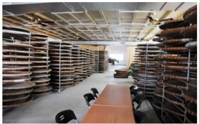
五星級製茶廠內部

前往各茶區現場查核評鑑過程中發現，經過多年來積極評鑑輔導，業者努力改善製茶廠後，以往的缺失(圖一)也逐漸改進，對於業者認真致力於改善製茶廠的環境衛生安全之努力深獲感動與肯定。例如：製茶過程時常揚起茶毛與塵埃，業者增加集塵設