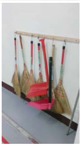
圖六、製茶清潔工具固定在特定的位置