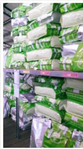
圖七、使用電子條碼方便盤點庫存量