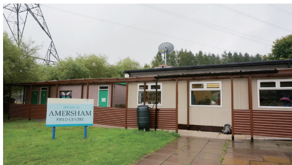
▲圖2、艾瑪遜田野中心門口意象／主建築物

艾瑪遜田野中心在英國田野學習協會 (FSC) 的所有中心裡面，是屬於一個較小中心，園區內只有 1 棟主建築 (圖 2)，內部包含 1 間辦公室、2 間可供學員課程使用的教室 (圖 3)、1 間可供來訪學員購買文具或紀念品的小賣店、1 間教具儲藏室與 1 間廁所。除此之外，還有一套小型的氣象站。