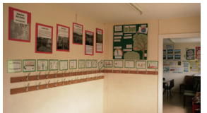
▲圖12、教室外的牆上有變電所的發展歷程圖說、學生作品展示，以及貼心的掛鉤設備

艾瑪遜田野中心因地理環境資源較差，又為一單日型中心，存在著生存競爭上的壓力，但只要夠用心、想方設法的擴展客源、精進產品內容，還是可以營運一個中心使其收支得以達到平衡，這是很值得我們學習且敬佩的地方。🌱