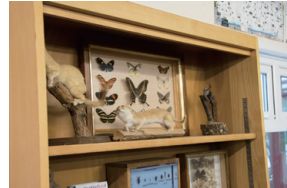
▲圖9、教室裡藏有許多的標本