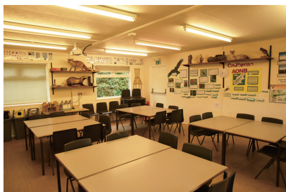
▲圖3、艾瑪遜中心共有兩間教室