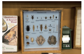
▲圖10、教室裡藏有許多的標本