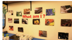
▲圖11、教室佈置一隅，每張圖片都可向上打開找答案及解說