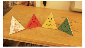
▲圖8、提供給學生用以表達對教師上課內容的理解與否