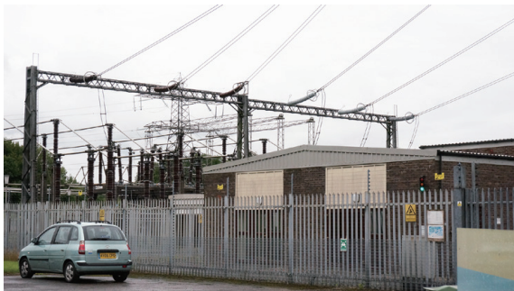
▲圖1、艾瑪遜變電所，緊鄰艾瑪遜田野中心

艾瑪遜田野中心位於倫敦市區西北邊約 40 公里處的白金漢郡 (Buckinghamshire) 奇爾特恩傑出自然風景區 (Chilterns Area of Outstanding Natural Beauty)，緊鄰著艾瑪遜變電所 (圖 1)，為英國國家電力供應公司 (NGG) 所屬的自然保留區。