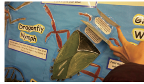
▲圖7、教室佈置一隅，池塘裡的生物解說

此外，在中心的教室佈置上（圖7），也可以看到很多的巧思與用心（圖8），不論是針對低年級或中高年級的學生，都有精緻的標本（圖9、10）、互動式的海報或剪貼（圖11、12），以及利用一些可愛精緻的小插圖來表現述說一些生活上友善環境的小提醒及相關知識等等，這些小細節不但可以讓來訪的學員自發性的學習，並且對這地方產生更多的喜愛與認同感。