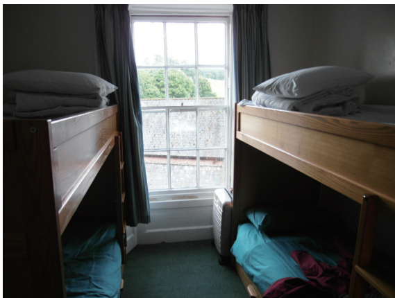
▲圖23、相對老舊的硬體設施與空間規劃，是奈特坎北宮田野中心希望解決的問題。

奈特坎北宮田野中心的營運狀況穩定，但仍認為應該要在穩定中求變求發展，以中心硬體設施來說，由於建築物的年代久遠，期間又經歷多次的增建，空間規劃凌亂，尤其是宿舍區域的房間大小不一，住房舒適度也有待提升。因此在 2016 年奈特坎北宮田野中心將進行大規模的整修，希望重新調整建物內的空間規劃，提升至 115 個床位，並且讓房間內皆有獨立的衛浴設備，希望能提供來訪學員更為舒適的學習與休憩環境！這樣的決定其實是個困難的挑戰，由於房舍結構老舊，空間的調整與新管線的架設都十分困難，經費也非一般建築物整修所能相比。