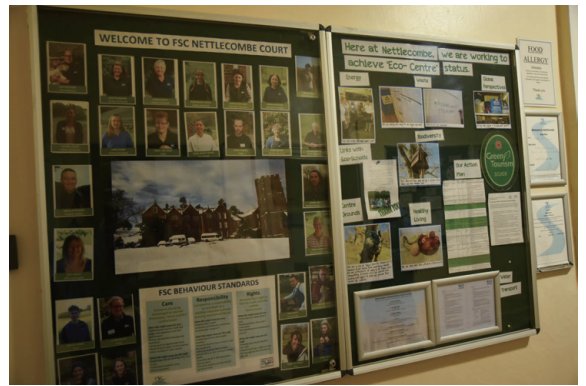
▲圖8、張貼於公布欄的場域人員照片。

除了教學與住宿必須的場域外，位於建築物一樓的中央餐廳是中心最著名的地點之一，高挑明亮的大廳放著長長的木桌椅，牆上古老的油畫與家族徽章裝飾，訴說著老房子的故事。此外，中心也提供了交誼廳、教師休息室、小酒吧、販賣部等，讓來到這裡的人們除了進行課程，課餘時能有放鬆休息的空間。