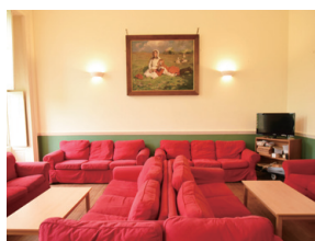
▲圖13、學生休息時可使用的交誼廳。