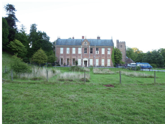
▲圖16、在中心旁的空地營造各式各樣的草地類型。