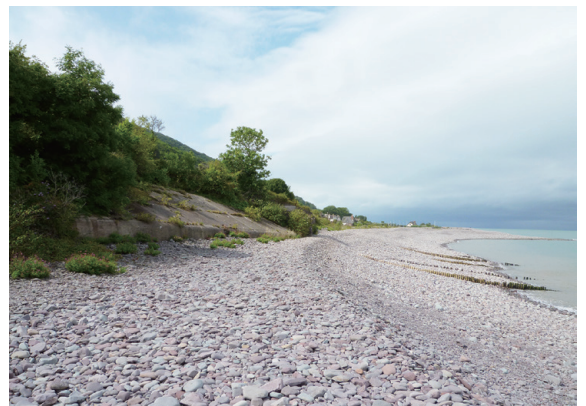
▲圖19、經由海岸邊不同的人為、天然環境，討論海岸經營管理的議題。

往東出發不遠，有一處名為 Minehead 海岸的區域，Minehead 原為一座海邊的小漁村，後來因大型的遊樂場進駐，轉變成以觀光、休閒等服務業為主的區域，與 Porlock 海岸的經營管理比較起來，有相當大的差異性。從觀察了解不同的環境發展規劃，讓學員學習完整的環境資源盤點與利害分析，若自己能參與規劃發展的過程，又該下什麼決定。中心主任