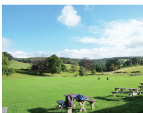
▲圖14、中心前的美麗大草皮，學員可在此運動。

奈特坎北宮田野中心是營運績效相當良好的 FSC 據點，每年約有 17,000 人／夜的服務量，2015 年預估有 130 萬英鎊的營業額。按照 FSC 的規定，中心每年必須上繳 20 萬英鎊的營業額，扣掉上繳的部分後，中心的獲利率仍達到 39%，這樣的績效在所有 FSC 的中心裡排名第 3，顯示除了課程的執行外，在成本控制、人員配置、經費運用、修繕管理等各方面，都表現得十分出色。