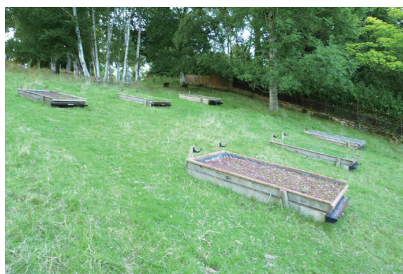
▲圖15、位於中心後方山坡上的土地排水試驗教學器材。

而鄰近區域的學校，中心則以到校服務的方式進行，或者與學校約定課程執行地點，教師直接帶著教材教具至區外授課，這不僅能減少鄰近學校的住宿經費負擔，也能提高中心的服務能量。除此之外，中心也提供場地與器材出借服務，中心租借場地、器材以及提供食宿服務，課程執行則由校方進行，這樣的服務主要在淡季時提供，對學校來說能以較便宜的價格讓學員前來學習，對中心來說則填補了淡季預約量較少的空檔，不僅能有經費的收入，也不會對人員安排產生太大的影響。