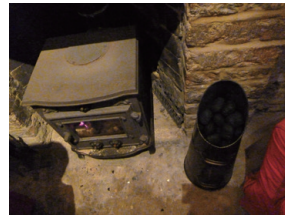
▲圖10、酒吧內的暖爐與煤球。