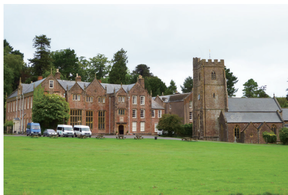
▲圖2、美麗古老的奈特坎北宮田野中心，是一座約800年歷史的私人宅邸。

一棟。房子的主人是當地大家族，FSC 與屋主簽訂了 50 年的租賃合約，合約內容十分有趣，每年 FSC 僅需負擔 25 英鎊的租金，不過除了經濟實惠的租金外，FSC 必須負責維護建築物的工作，讓房子持續保有原本的樣貌，這便是一筆十分龐大的經費支出了！