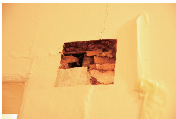
▲圖5、舊建築的維護專家將牆壁挖開，設法了解建築建築物的結構與材料。