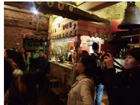
▲圖9、FSC每個中心都有自己的特色小酒吧。

除了教學與住宿必須的場域外，位於建築物一樓的中央餐廳是中心最著名的地點之一，高挑明亮的大廳放著長長的木桌椅，牆上古老的油畫與家族徽章裝飾，訴說著老房子的故事。此外，中心也提供了交誼廳、教師休息室、小酒吧、販賣部等，讓來到這裡的人們除了進行課程，課餘時能有放鬆休息的空間。