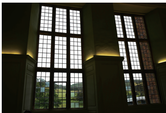
▲圖4、數百年前的窗框由木條所建成，由於沒有固定的規格，損壞後的維修難度與價錢都十分驚人。