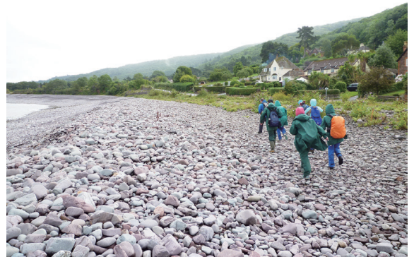
▲圖18、環境特殊的波洛克海灣，是奈特坎北宮田野中心的重要教學據點。

行人為居住、防災建設、環境演替等多不同的議題進行討論評估，讓學生了解不同的選擇需付出不同的成本，同時也有不同的效益產生。