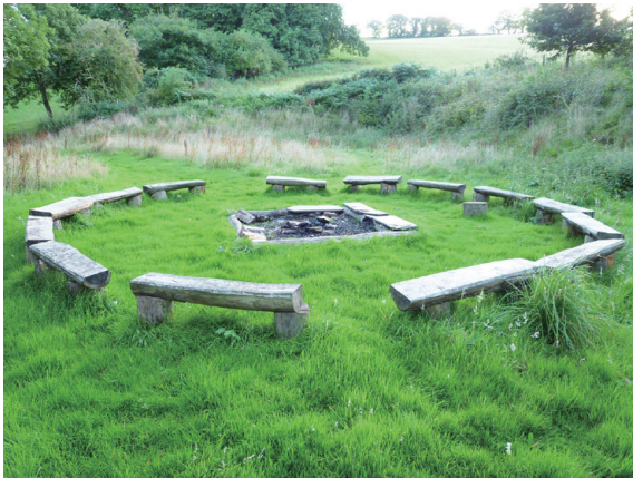
▲圖17、山坡上的營火場，學員在夜晚時分聚集，感受彼此凝聚的情感。