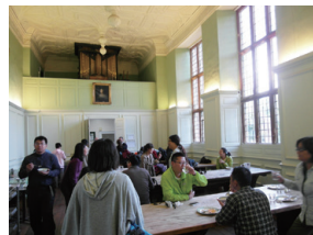
▲圖11、一樓的大廳現在作為餐廳使用。