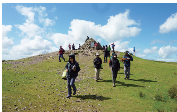
▲圖21、美麗的埃克斯穆爾國家公園（Exmoor National Park）不僅是中心的教學場域，更是重要的合作夥伴。

唯有良好的夥伴關係，才能永續的營運與成長，FSC 的各個中心成立之後，皆積極的與其他相關團體建立良好的溝通，奈特坎北宮田野中心也不例外，無論是鄰近的私人土地地主、周遭的學校團體、地方政府、國家公園等，都是中心努力合作的對象。而在環境教育的執行上，埃克斯穆爾國家公園除了是奈特坎北宮田野中心所使用的教學場域，中心也會協助國家公園的教育人員共同培訓在地教師，並非把對方視為業務的競爭對象。