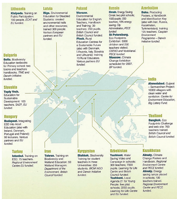
▲ FSC 的國際合作計畫遍及全球

FSC 歷年來不斷與世界各地相關組織專案合作，但是多屬單一專案或短期交流。FSC 與林務局的合作關係不只長期，林務局更將 FSC 的經驗融入、落實到自然教育中心的發展體系之中，且針對特定主題不斷深化，這是 FSC 與他國的合作當中少見的模式。MoU 行動計畫的執行過程中，林務局自然教育中心似乎是受惠較多的一方，但事實上對 FSC 來說，也有相當多層面的受益：