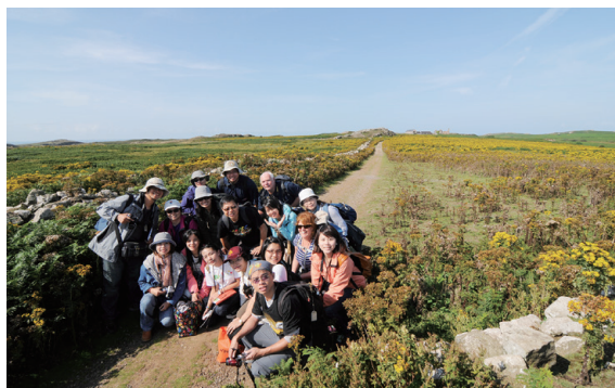
▲2013 年的 FSC 參訪，林務局自然教育中心成員前往教學場域觀摩並實際演練 FSC 的課程方案

2014 年，Rob Lucas 來到臺灣，為臺灣 100 多位環境學習中心的高階管理者、資深實務經營者、相關領域之專家學者舉辦了一場「環境學習中心營運管理專業論壇」，Rob Lucas 分享了 FSC 走過 70 年英國政治、經濟、社會、環境變動的因應對策，以及如何建立品