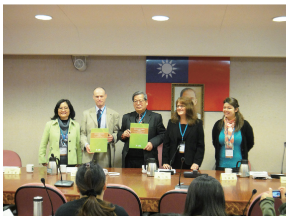
▲林務局與FSC簽訂5年合作計畫，展開一連串的交流學習

立了雙邊合作關係，2010年8月雙方正式簽署合作備忘錄（Memorandum of Understanding, MoU），以「專業成長」、「品質評鑑」、「創新環境教育」、「資訊與出版」為主要合作面向，在2011～2015年5年行動計畫中展開一連串的交流與學習，提供林務局自然教育中心相關人員每兩年一次前往英國實地觀摩學習的機會。