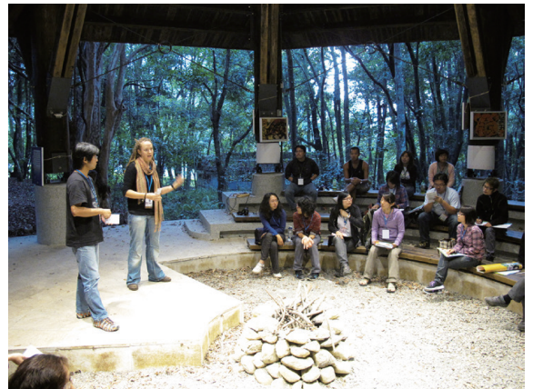
▲在 FSC 資深環境教育教師的引導下，檢視林務局自然教育中心的課程規劃方向

2012 年 10 月，FSC 人員再度來臺，延續前一年的行程，前往池南、知本、雙流自然教育中心參訪，針對「教學品質」及「健康安全」提出觀察建議。此外，在林務局舉辦的「自然教育中心品質優化及永續經營論壇暨內部專題研討會議」，第一次將 FSC 的資訊對外部單位分享，主題包括「英國環境學習場