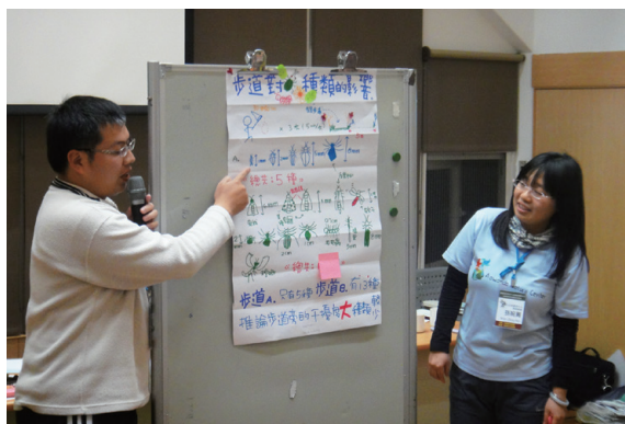
▲林務局自然教育中心環境教育教師在2011年的「『教與學』專業成長工作坊」開始思考將科學方法具體融入教學當中