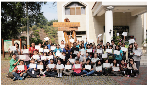
▲2014 年的「科學調查課程規劃與教學技巧工作坊」讓科學調查的精神融入林業相關主題課程當中

2015 年，20 位林務局自然教育中心的經營管理人員與環境教育教師再次造訪 FSC，走訪 5 個中心的過程中，體驗 FSC 低年級學童的課程、操作了「國家公園遊憩管理」及「氣候變遷下的海岸管理」地理課程，管理議題方面了解了 FSC 的財務風險控管策略、當前面臨的挑戰與因應、組織調整歷程與效益、碳管理目標與作為。Rob Lucas 在短短的互動時間內提供精準且紮實的內容與建議，並再度讚揚林務局自然教育中心內化 FSC 經驗的努力，以及對未來持續合作的期待！