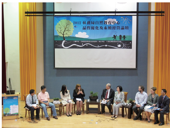
▲「自然教育中心品質優化及永續經營論壇暨內部專題研討會議」將FSC的營運經驗分享給外部單位，讓臺灣各環境教育場域一同成長

域之內外部評鑑系統」以及「評鑑結果運用於 FSC 績效管理之對應策略」，而 FSC 也為林務局自然教育中心規劃了內部會議，分享 FSC 課程方案自我評鑑機制，以及 FSC 人員內部評鑑與人力資源優化策略。此時，林務局自然教育中心先於環教法環境教育設施場所評鑑之前，已開始為內部自我評鑑做準備。另外，在知本自然教育中心執行的「『科學調查課程規劃與戶外教學』工作坊」中，也更加深化了林務局自然教育中心科學調查課程及安全管理的實務能力。