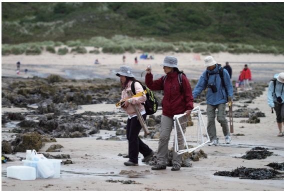
▲林務局人員在 MoU 簽訂之後來到 FSC 參訪，並實地到海岸進行調查課程

同年 8 月，林務局自然教育中心夥伴也首度在 MoU 簽署之後飛抵英國，參觀了 4 個 FSC 轄下的田野中心，透過實際的課程參與，實地了解到科學調查方法融入教學，實為 FSC 保育自然資源的基本策略；也在停留 FSC 購買或租賃經營的中心建物期間，體認 FSC 如何透過實際行動保存文化資產。這一年，也是我們第一次與《The Curious Mind of Young Darwin》相遇，因而促成了中文版《小達爾文的探險旅程》的出版。此行，我們還看見 FSC 縝密的營運策略規劃，以及如何透過績效管理、目標管理、評鑑機制等管理工具，讓 18 個中心及總部的各部門同步向前邁進，達成組織宗旨與目標。