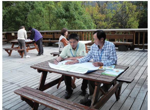
▲中心管理人員透過工作坊思考林務局自然教育中心的營運策略

技巧。值得一提的是，工作坊之後，兩組人員分別建議未來不要分組進行，期待 FSC 帶來的各項專業能讓不同部門的人都有機會接觸。