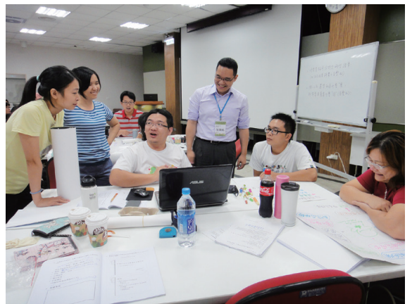
▲林務局自然教育中心透過各種培訓、會議、研討，將向FSC學習之主題轉化、內化為自身的策略

林務局從 FSC 取得的發展經驗，除了用於自然教育中心的階段性發展需求之外，也透過交流場合以及資訊公開等方式，將許多共通性議題及成果與外部單位共享，期盼和臺灣所有環境學習中心一起借他山之石，共同成長。