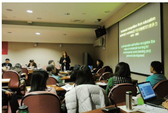
▲FSC人員於2011年「『峰頂的對話』圓桌會議」分享FSC的永續經營之道

2011年1月，FSC人員在MoU簽署之後首度來臺，也是5年合作計畫中第一次的面對面交流。這是一次開展性的互動，「『峰頂的對話』圓桌會議」首度接觸了FSC的發展史，並且初步了解FSC組織永續經營與管理、環境學習品質控管與認證、人員的專業發展與培力等議題；在八仙山自然教育中心針對教育推廣人員舉辦的「『教與學』專業成長工作坊」以課程規劃、教學技巧、安全管理3大主軸進行，這是林務局自然教育中心與FSC科學調查教學方法、安全管理實務操作守則的第一次接觸。