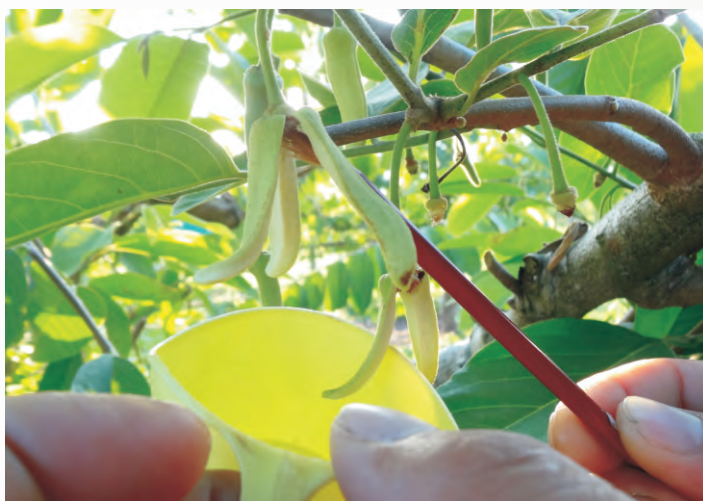
圖3-13 直接用授粉筆採集花粉（藥）情形

此為當天採集花粉並授粉之作業模式。採集方法為在果園間找尋已達雄花期之花朵（番荔枝臺東2號為早上6~8點；鳳梨釋迦下午4點至8點），採集時以手持容器置於花朵下方，再直接用授粉筆將花朵內花粉（藥）撥入容器中（圖3-13）。因花粉（藥）成熟時間短，需掌握時效，以免無法採集到足夠之花粉。