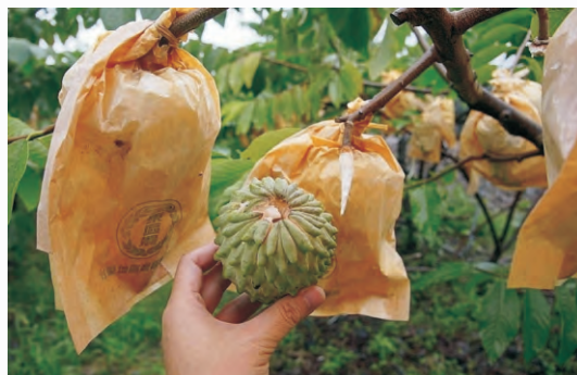
圖3-22 鳳梨釋迦3-4月遇高溫易落果(抽心現象)