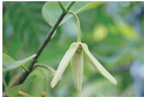
圖3-12 雄花期-花瓣開張，雄蕊成熟