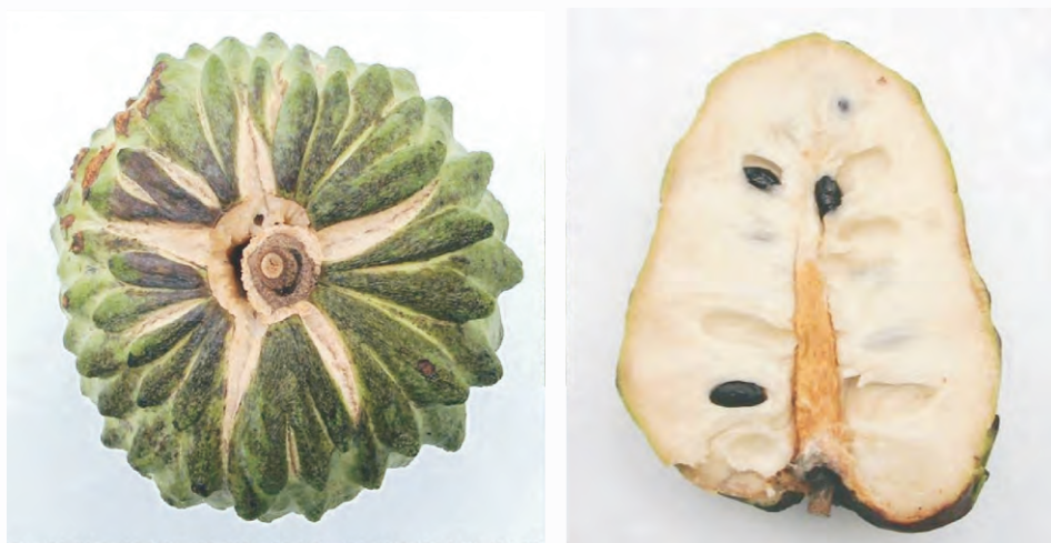
圖3-25 鳳梨釋迦夏秋季果實在採收後熟階段極易裂果、發霉

鳳梨釋迦由於夏、秋期果，因果實在採收後熟階段易裂果、發霉(圖3-25)，缺乏商品及食用價值，仍以採收12月起之冬期果為宜。