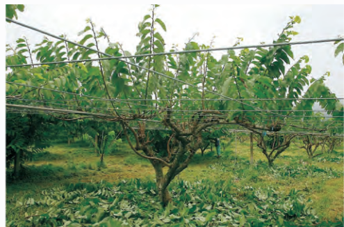
圖3-8 鳳梨釋迦疏剪與產期調節修剪一次進行，修剪前(左) 修剪後(右)