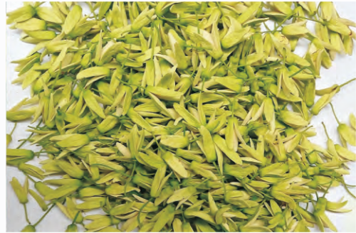
圖3-15 採集之雌花期花朵