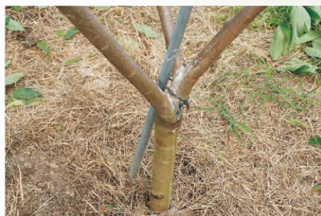
圖3-5 鳳梨釋迦主枝角度之分佈