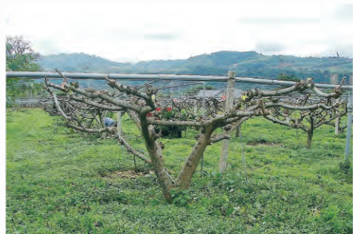
圖3-7 鳳梨釋迦春季進行強剪，修剪前(左) 修剪後(右)