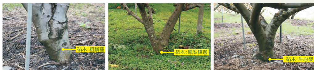
圖3-1 鳳梨釋迦不同砧木之生長情形-粗鱗種(左)鳳梨釋迦(中)牛心梨(右)