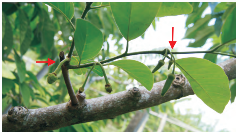
圖3-9 花著生於新梢基部或新梢葉片對生位置

鳳梨釋迦修剪後，花通常著生於新梢之基部或於新梢葉片對生位置(圖3-9)，為單花著生或1~5朵花簇生，且同一枝條可連續開花。