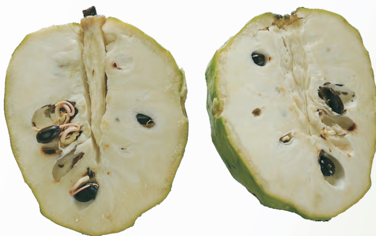
圖3-23 鳳梨釋迦5月份採收之果實內種子易萌芽