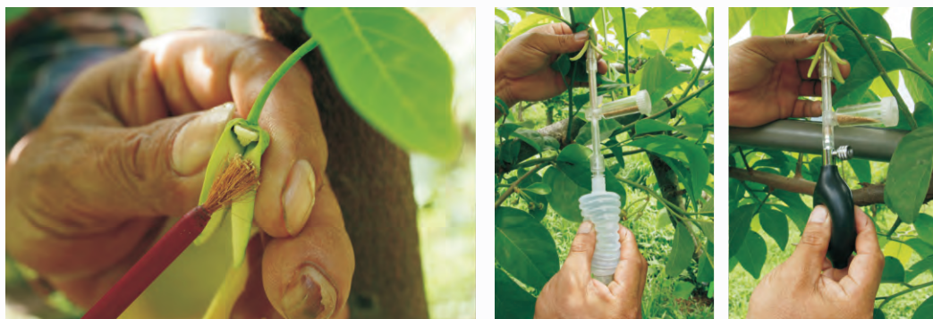
圖3-18 鳳梨釋迦人工授粉方式－授粉筆(左)、授粉器(中、右)