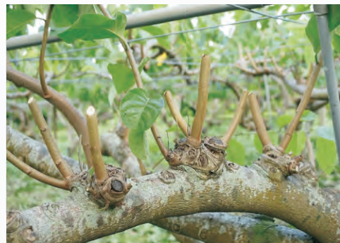
圖3-20 鳳梨釋迦產期調節修剪一枝條短截並去葉