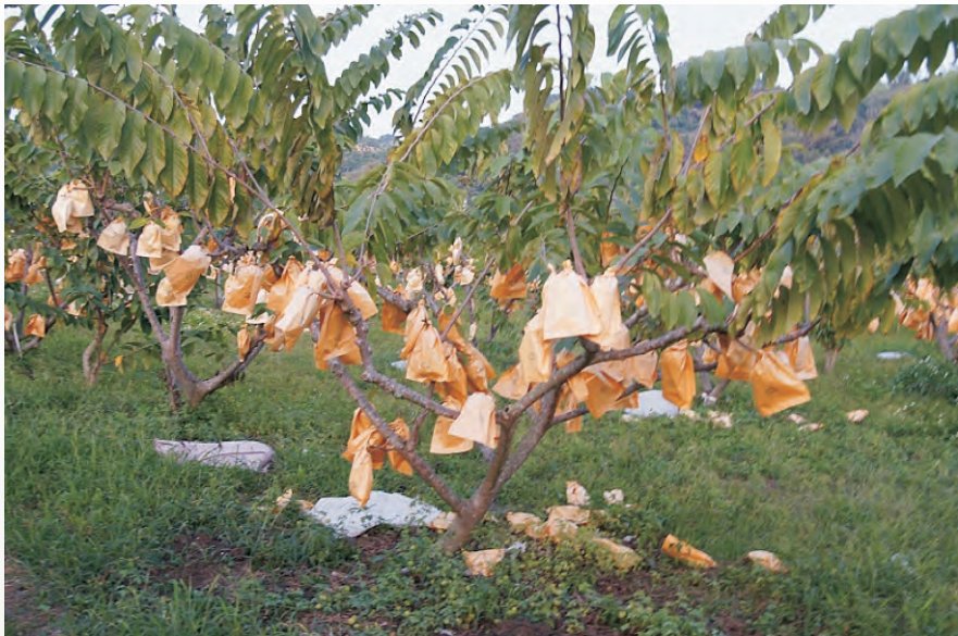
圖 3-24 留果數過多易造成植株衰弱、落果