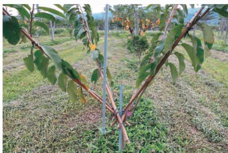
圖3-4 鳳梨釋迦主枝以3~4枝為宜

自苗木定植園間起，即須進行樹型基本架構之建立，首先於主幹60~80公分處截斷，以培育主枝。主枝以2~4枝為宜，養成自然開心型樹型（圖3-4、圖3-5）。植後2~3年間，於進行冬季修剪時，應使各主枝向外均勻伸長，再於主枝長度40~100公分處培養2~3枝亞主枝，各亞主枝間隔應有30公分以上為宜（圖3-6）。往後每年在主枝及亞主枝上會萌發許多側枝，此即為可開花著果之枝條。