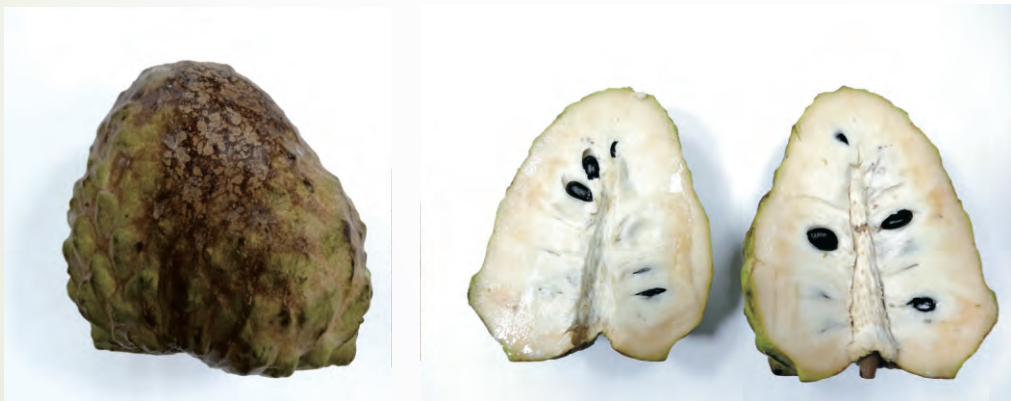
圖3-27 果實低溫儲藏寒害情形

鳳梨釋迦屬於低溫敏感性水果，果實採收後之硬熟果，在溫度 12\sim 35^{\circ}\text{C} 下，約 4\sim 9 天可自然軟熟；在 12^{\circ}\text{C} 以下果實易發生寒害，無法正常後熟。硬熟果於 7\sim 12^{\circ}\text{C} 低溫下短暫( 5\sim 7 天)儲藏，再取出置於室溫下軟熟，可延長儲藏時間；但如低溫貯運時間過久或儲藏溫度過低易有寒害現象出現(圖3-27)。