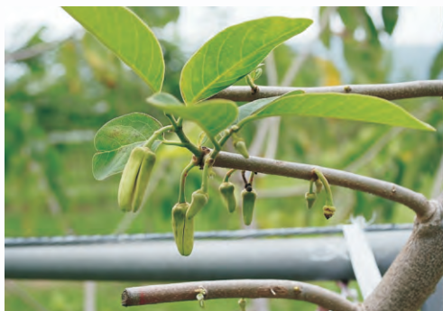
圖3-21 鳳梨釋迦產期調節—枝條短截後萌芽開花