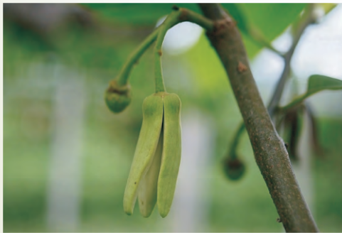
圖3-11 雌花期-花瓣開裂，雌蕊成熟

鳳梨釋迦自小花蕾形態發育至花藥開裂，期間約需34天。在花瓣展開前，雌蕊仍保持青綠色，且三個肥厚肉質花瓣間保持閉合狀態。約至第27天開始，花瓣始自頂端產生裂痕，但花瓣仍未分開。約第29天起花瓣分開，此時雌蕊已成熟，即為雌花期(圖3-11)，花瓣顏色亦轉變為黃綠色或淡綠色。當發育至第33天時，花瓣已張開成 60^{\circ} 以上夾角，此時為雄花期(圖3-12)。而當花藥囊成熟，花粉散落後，花瓣當日即軟化枯萎，完成花朵發育之全部過程。鳳梨釋迦各品種雄蕊花藥成熟時間相似，均在下午4點至8點間。花藥散放時間會受氣候影響稍有變動，如陰天、日照弱、氣溫低，則花藥散放時間會稍微提前(早)；而當天氣晴朗日照強、氣溫高時，則花藥有延遲散放情形。