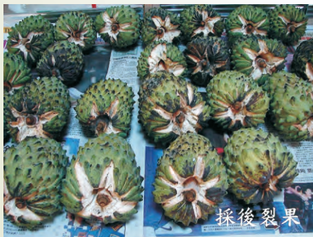
圖3-19 鳳梨釋迦夏、秋果採後易裂果

鳳梨釋迦進行產期調節時應考量果園之地理位置及地形，以生產12月至翌年3月份之果實較佳；4月份開始氣溫偏高，且臺東地區易發生焚風或南風現象，常會造成果實抽心落果現象（圖3-22）。建議於較冷涼地區可生產4月份果實，而5月份果實掛樹時果實內種子易萌芽（圖3-23），影響品質，故亦不建議生產5月份之果實。