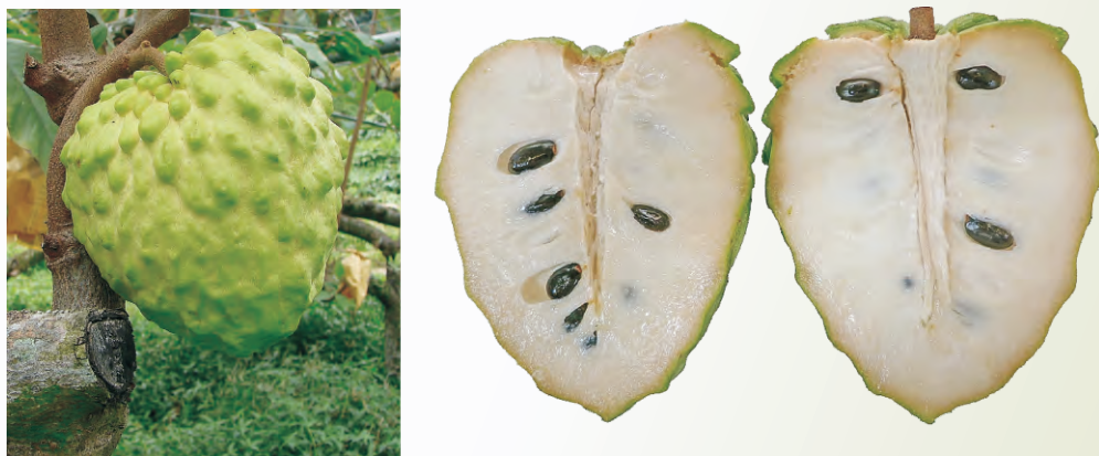
圖3-26 適採期之果實顏色由綠色轉為黃綠色，且果頂凸起之鱗目已較平順(左)及軟熟果之剖面(右)

鳳梨釋迦果實發育為S型曲線，花朵授粉著果至採收，依品種、氣候情況與栽培環境等不同需140~160天。田間採收成熟度判斷標準由外觀果實顏色由綠色轉為黃綠色，且果頂突起之鱗目已較平順(圖3-26)。成熟度較低的果實，雖仍可正常軟熟，但果肉率及果實可溶性固形物含量偏低，果實品質差；成熟度太高之果實，採後即快速軟熟，不耐貯運。