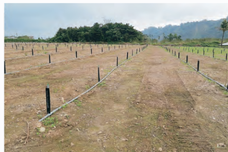
圖3-3 果園規劃-定植及灌溉設施規劃