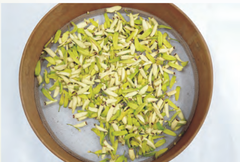
圖3-16 於濾網收集花粉(藥)