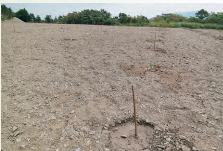
圖3-2 果園規劃-整地及寬行種植規劃