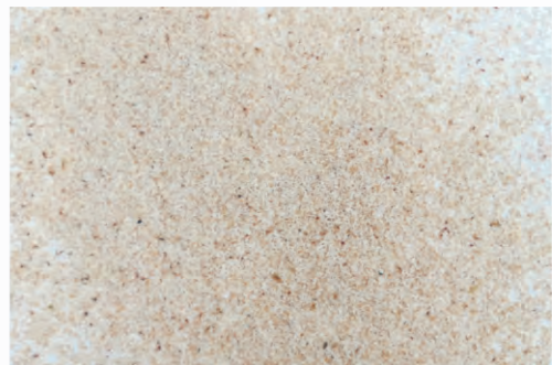
圖3-17 含花粉之雄花藥