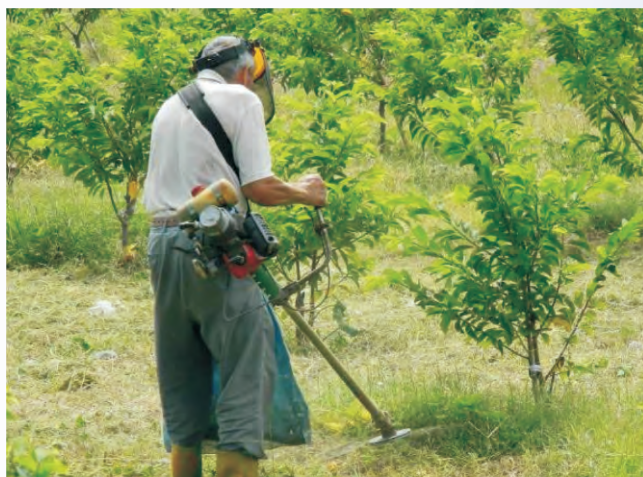
圖5-2 樹冠下不利乘坐式割草機行走，仍須使用背負式割草機除草