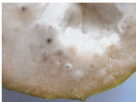
圖5-10 鳳梨釋迦缺鈣，接近果皮處之果肉可發現黑色異常粒狀物