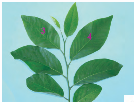
圖5-5 採樣部位為非結果枝，頂端算起第三或第四葉片