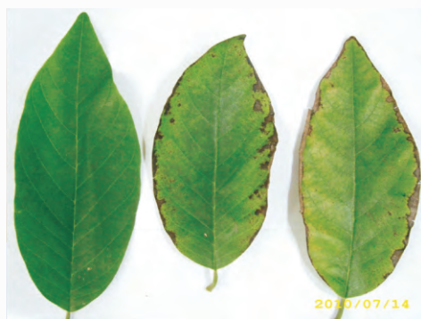
圖5-11 硼過量，輕者會導致葉緣呈褐化焦枯