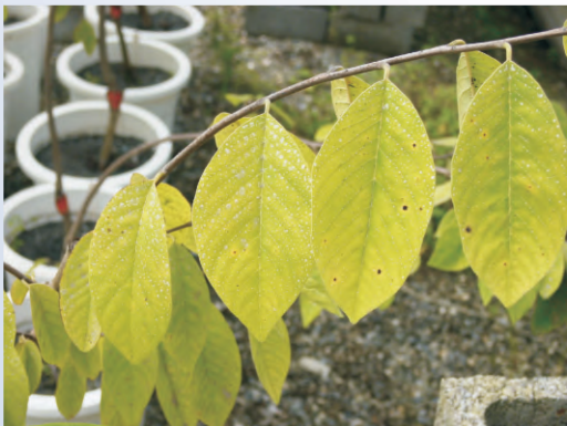
圖5-8 缺氮的鳳梨釋迦葉片新梢到枝條底部有漸層黃化現象