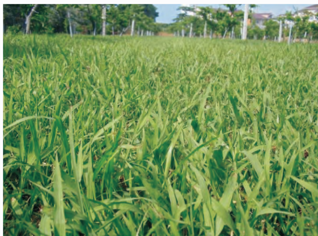
圖5-3 每年割刈5-6次，數年後兩耳草將成為果園優勢草種