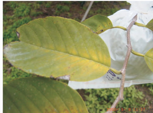
圖5-9 鳳梨釋迦葉片缺鎂，老葉之葉脈間有黃化現象