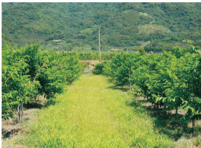
圖5-1 果樹行株距勿過密，整平且撿除石礫，使果樹行間方便以乘坐式割草機割草