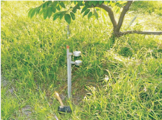
圖5-4 土壤水分張力計埋設深度分深淺二支，分別為30公分及60公分