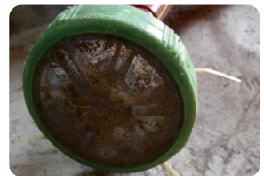
圖8. 注意吸水管的清潔