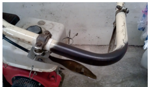
圖4. 中耕機之轉向離合器把手