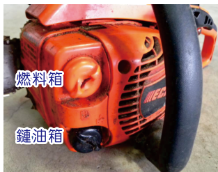
圖9. 燃料箱與鏈油箱的位置