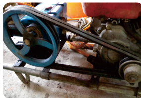
圖7. 噴霧機的三角皮帶鬆緊度