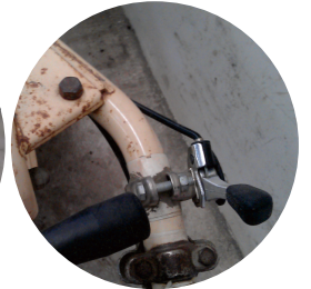
圖3. 加油座推桿用來 控制引擎轉速