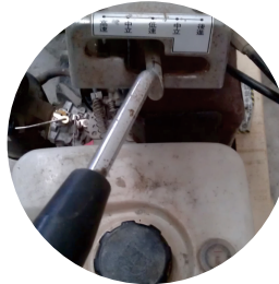
圖2. 變速桿用來控制 刀具轉速