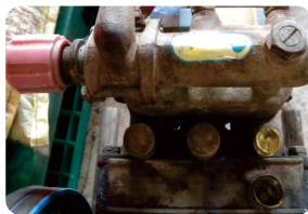
圖6. 噴霧機的牛油杯位置