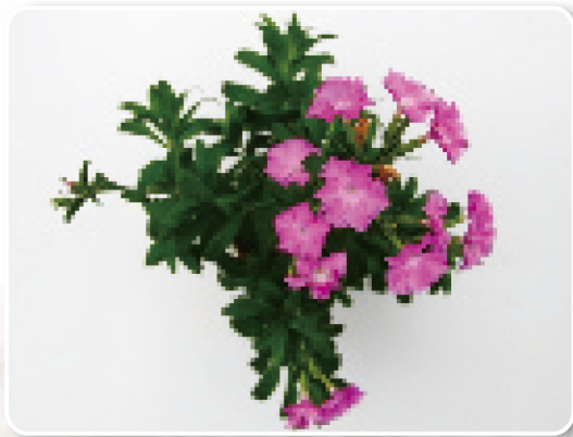
圖3. OD1033(臺東二號香粉雲)

熱可週年開花，具微香，與父本相較，花梗硬挺直立不易倒伏(圖6)，為此類花序中之重要優良性狀，顯示其可做為花壇應用。OD1077之母本為Goldsmith Seeds公司育出品種D.'Dulce'，父本為清水山石竹，其花色具有白至深紫紅色之漸層特性(圖8)，極富觀賞價值，香氣極濃厚，株高中等，花期長，可週年開花，耐候性亦佳。以上3優良品系皆可作為盆花或花壇群植應用。