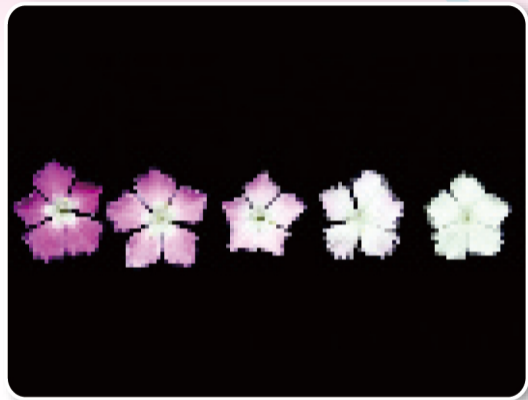
圖8. 潛力品系OD1077之單株花色變化