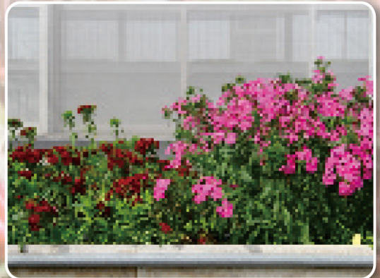
圖6. 潛力品系OD1036(右)與美國石竹福神(左)露天種植