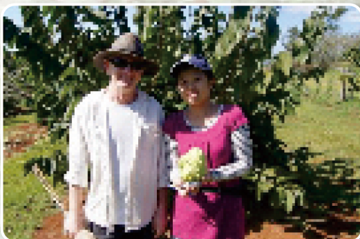
圖9. 新南威爾斯州熱帶園藝中心管理員與鳳梨釋迦果園