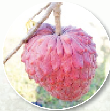
圖8. Maroochy研究站預計命名之紅皮鳳梨釋迦品系