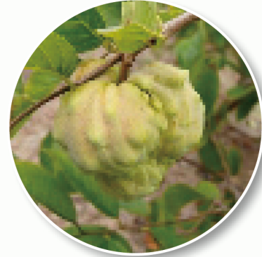
圖7. 澳大利亞鳳梨釋迦栽培品種 'KJ Pinks'果實