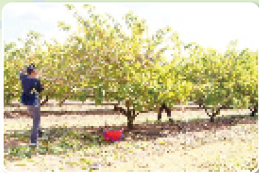
圖11. 鳳梨釋迦機械修剪完後輔以人工除草