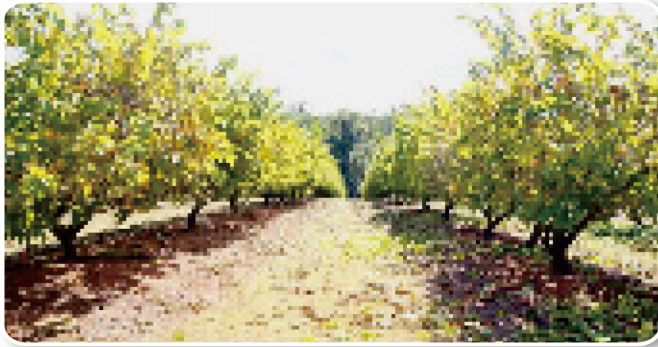
圖6. 昆士蘭州陽光海岸Glasshouse mountains 鳳梨釋迦栽培情形

Different Temperature and Relative Humidity on Pollen Germination of 'Taitung No2.' Sugar Apple ( Annona squamosa L.))，與會學者對於授粉器相當感興趣，現場討論熱絡(圖12)。