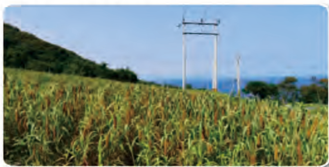
圖5.多良部落示範田區小米生育情況

兩試區共完成三次土壤取樣調查，土坂試區在試驗前之土壤分析結果顯示土壤無酸化問題，土壤有機質、鈣、鎂含量無偏低之情形，磷、鉀等含量則有偏低的情形(表8)。在試驗後期之土壤分析結果顯示，施用有機肥的處理的土壤有機質、磷、鉀、鈣、鎂等含量大致上皆高於無施用有機肥之其他處理，顯示土壤施用有機質肥料，可有效提升土壤營養元素之含量。