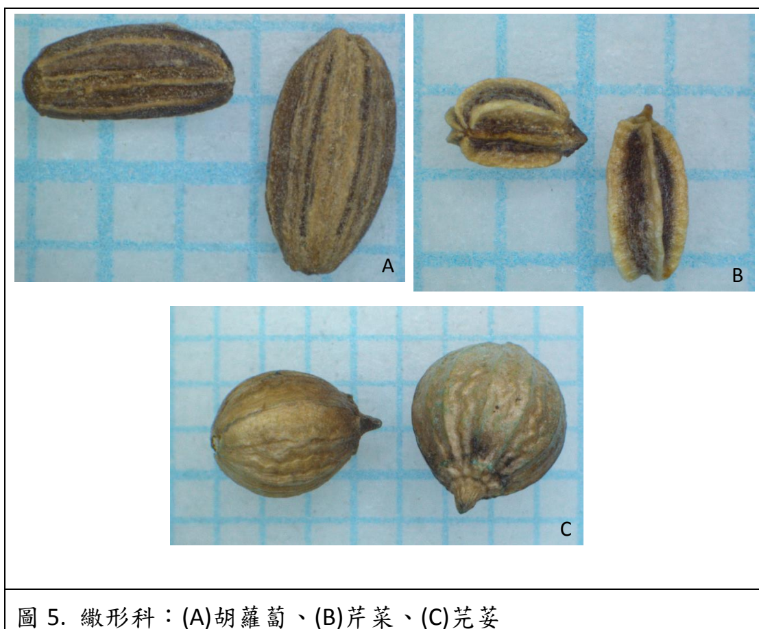
圖 5. 繖形科：(A)胡蘿蔔、(B)芹菜、(C)芫荽

繖形科種子較小，種皮不易與果皮分開，一般以果實形態作為播種材料，果實由兩單果組成，有些作物的果實成熟時兩單果易分離，具果稜，有些稜上具刺毛，稜下具油腺，可散發味道，故繖形科種子具特殊香味，為其主要特徵。不同作物間的種子形狀和尺寸外觀差異大。代表作物為胡蘿蔔、茴香、芫荽及芹菜等(圖 5)。