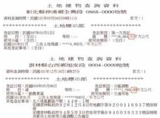
▲圖2、上圖為重測區；下圖為圖解區土地謄本