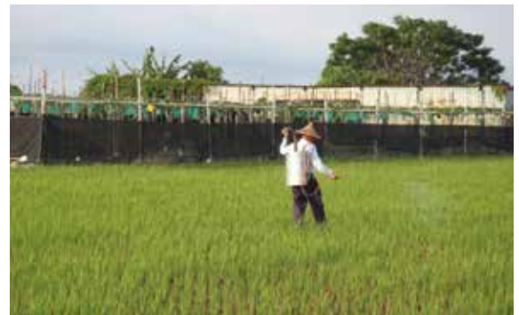
▲圖3、健康的土地、健康農業生態系及健康人民需要政府、農民及消費者一起努力。