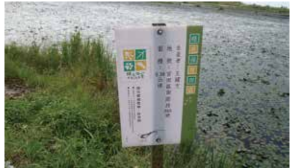
▲圖2、林務局和臺南市政府農業局為了保育水雉發展出讓水雉與菱角／水稻田農民共生的策略和方法。