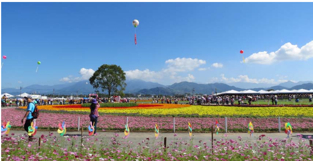
【圖一】繽紛豔麗的精緻草花區

104年11月7日至12月6日止，為期30天的新社花海活動，為配合活動期間展現最亮麗繽紛花海，本次精緻草花區選用較以往不同的草花，如頭狀雞冠花、槍狀雞冠花、青稞、觀賞小米、醉蝶花及紅藜等，以凸顯亮麗顏色（圖一）。同時配合近30公頃的撒播景觀綠肥區，以塑造數大便是美及繽紛豔麗的景觀。