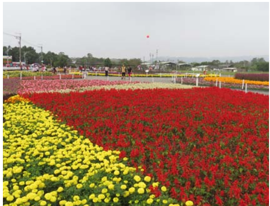
上 | 【圖二】精緻草花區 -- 「流水連華」區 左中 | 【圖三】「龍馬精神」區、右中 | 【圖四】「心心相印」區 左下 | 【圖五】「相親相愛」的花海花仙子、右下 | 【圖六】「豐收圓滿」區