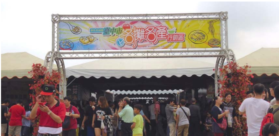
臺中市名攤名產行銷區展館入口意象