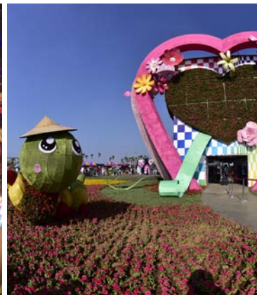
左 & 中 | 萬花之心內部萬花筒、右 | 萬花之心外觀