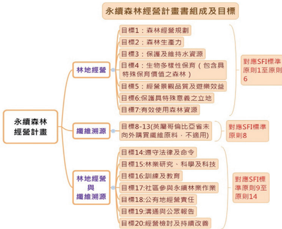
▲圖1、BCTS永續森林計畫書組成及目標 (SFI標準 2004)

表，將達成經營目標所需的各項工作，依照所屬的目標、績效衡量、指標等階層自上至下條列出符合標準所需工作之說明、應參照之資料或規範來源，以及完成該項指標工作的內部單位或外部廠商。