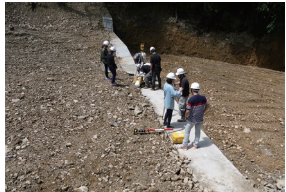
▲圖14、學員至魚池鄉白石牙野溪整治工程現場進行各類測量模式演練

第5週安排參訓人員至魚池鄉白石牙野溪整治工程現場辦理施工查驗演練及河道地形測量演練，實際進行各類測量模式訓練，以提升現場測量能力，透過本次紮實的訓練，全面提升參訓人員之測量實力，成為林務工程測量新尖兵。