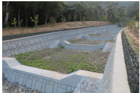
▲圖8、設計方便蛙類及爬蟲類攀爬的高差通行方塊

固床工為一橫向構造物，常採用連續施設方式而構築成一系列固床工，以調整河床坡度及控制流心，然固床工形成之高差將會限制蛙類及爬蟲類等小型動物沿河道縱向通行，為避免固床工高差阻斷縱向通道，設置高差通行方塊，其作法是於固床工兩側設置緩坡爬坡，表面鑲砌現場塊石增加糙度，供動物通行使用。