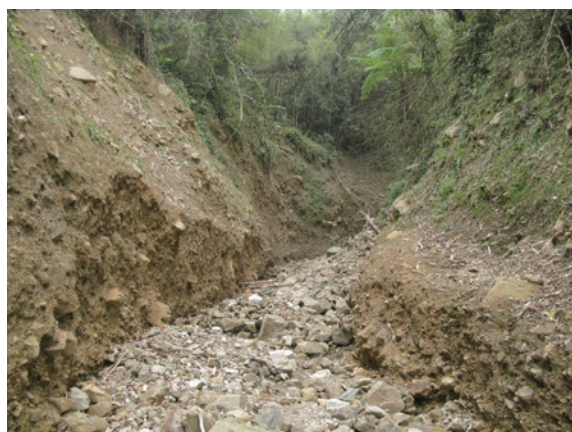
▲圖3、白石牙野溪上游土石流切割兩岸，形成V型山谷。

權責分工確定後，為避免災害持續擴大，南投林區管理爭取當年度經費，先於上游陡峭V型峽谷設置1座防砂壩及2座潛壩，先對土石輸出作有效控制，隔年再接續興建6座潛壩以調整溪床坡度及控制流心，並增加土砂庫容量及維持生物橫通道暢通，本年度(105)接續辦理第3期整治工程，除考量工程整治效益外，還納入生物需求，以少量經費設置生態廊道，讓生物於整治後依然可於本區暢行無阻，營造生態友善環境。