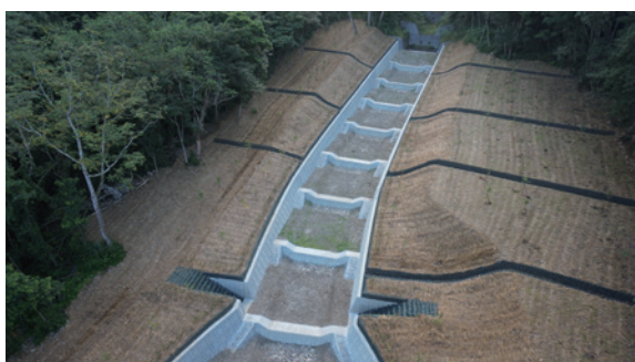
▲圖9、以植生袋疊砌而成的橫向排水溝，加強坡面排水，穩定邊坡安全。

本工程為穩定兩側回填邊坡安全，設置橫向排水溝加強坡面排水，排水溝以植生袋疊砌而成，護岸頂層也應用植生袋收邊，確保坡面水順利排入河道，植生袋裝填現地土砂拌合草種及肥料進行植生綠化，節能又減碳。