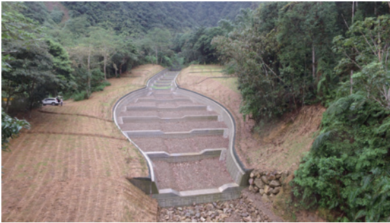
▲圖6、「魚池鄉白石牙野溪整治工程」於下游擴大斷面營造土砂庫容區，配合平時維護管理，可有效保全下游九族文化村及大林村民安全。（攝影／林永欣）

考量整體治理效益，本工程接續前期系列潛壩施作，下游坡度已較為平緩且河岸較為低矮，配合地形宜採護岸河道方式延續整治，並可於下游擴大斷面營造土砂庫容區，配合平時維護管理，可有效維護下游保全對象安全。