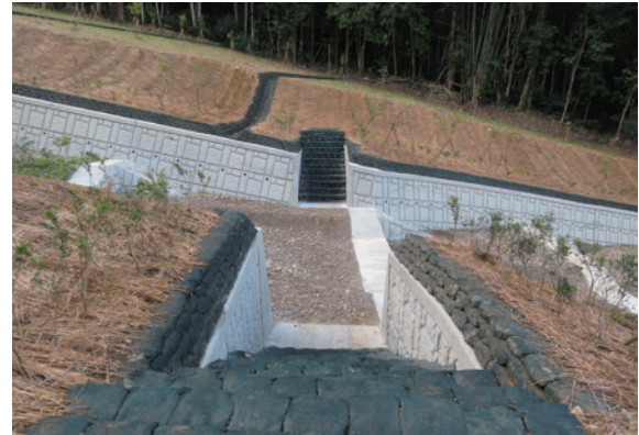
▲圖7、設計供山豬通行之橫向生態廊道

護岸設施是一種沿河岸連續構築於岸坡之構造物，可保護河岸安全及穩定坡腳，防止溪岸遭洪水冲刷流失或邊坡崩塌，惟護岸條狀設施常造成動物橫向通道受阻，致棲地間產生阻隔。考量本區河岸兩側分佈竹林及牧草區，盛產竹筍及牧草筍，為山豬食材，山豬常須穿越河道覓食，設計時觀察山豬常出沒山徑位置設置生態廊道，生態廊道的作法是先於護岸開口，增設封牆，考量水流冲刷基礎排列現地大塊石，坡面採緩坡設計，表面鋪設植生袋營造較近自然的動物通道。