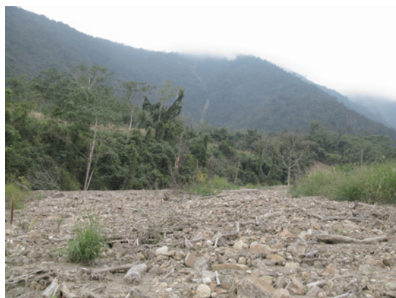
▲圖2、白石牙野溪土石流淹沒附近農地

災害發生後林務局南投林區管理處與水土保持局南投分局共同會勘，確認此野溪下游有保全對象，確有治理之必要，並協調上游林班地由林務局治理，下游一般山坡地由水土保持局接續整治。