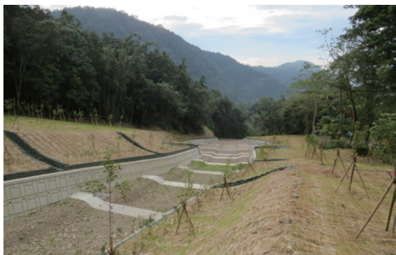
▲圖10、坡面導入楓香及赤楠等本土樹種，層次造林。

整治區結合景觀設計後可營造出綠美化環境，本工程回填坡面採緩坡設計，坡面撒播草種並覆蓋稻草蓆，快速回復地表植生綠化，坡面導入本處自有苗圃培育楓香及赤楠等本土樹種，進行層次造林，營造生物友善棲息空間。