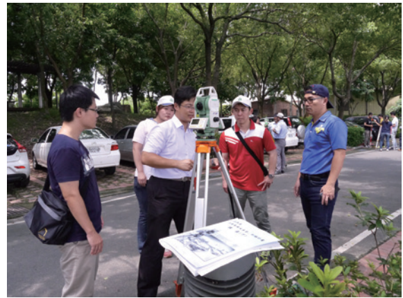
▲圖13、透過分組演練讓參訓人員熟悉儀器之操作技巧及增進團隊默契

第4週由南投林區管理處同仁分享「國有林地自辦設計電腦繪圖經驗分享」，綜合基礎課程研習成果，分享自辦設計程序經驗；下午室外測量實習課程登場，動用超過6台全站測站經緯儀，透過分組演練讓參訓人員熟悉儀器之操作技巧及團隊默契，深化測量基本素養，最後進行座標測量及放樣測量之測驗，以驗收參訓成果。