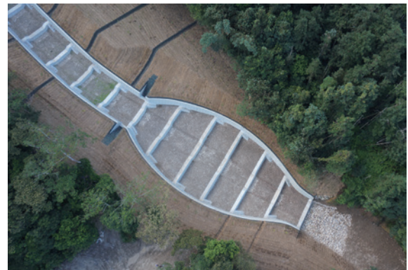
▲圖1、多一份生態考量，營造出友善環境的生態工程。

理「魚池鄉白石牙野溪整治工程」，在確保工程效益及安全前提下，嘗試營造友善環境的生態工程，讓該區野生動物於整治後依然可於該區無礙通行，讓治山防洪工程與生態保育更為融合。