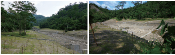
▲植栽陽性樹種—臺灣櫟、▲邊坡鋪蓋稻草蓆及撒播草籽相思樹。