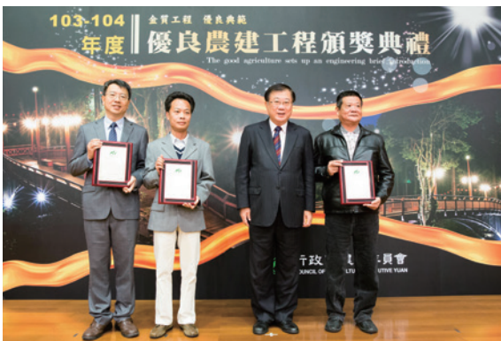
▲ 103~104 年度優良農建獎