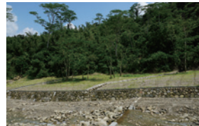
▲多孔隙環境，增加生物棲息空間。