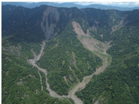
▲98年莫拉克颱風後上游大面積崩塌

亞美坑位於臺南市南化區關山里，為南化水庫上游支流，98年莫拉克颱風，亞美坑集水區崩積土方達148萬立方公尺，土砂嚴重淤積河道影響通洪斷面，為確保亞美坑橋、當地居民及南化水庫安全，林務局嘉義林區管理處（以下簡稱嘉義林管處）於災後旋即展開調查災害，自100年起分年分期辦理3期整治工程，投注經費近4千萬，本案為接續之第4期整治工程。