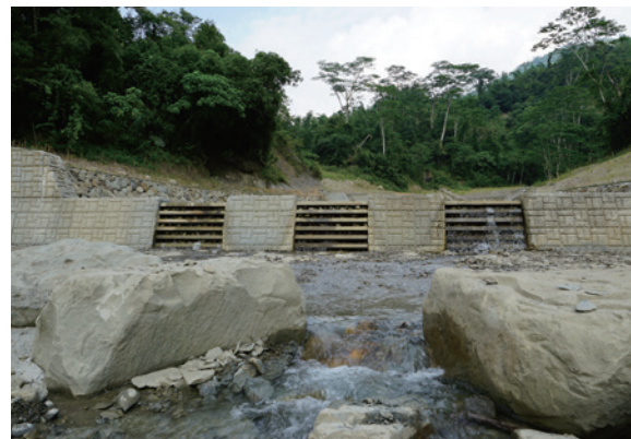
▲透過性H型鋼壩，淨化水質。