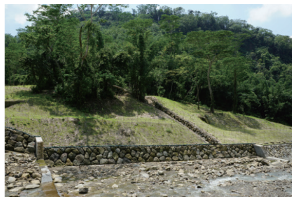
▲保護林木，確保動物生育地。