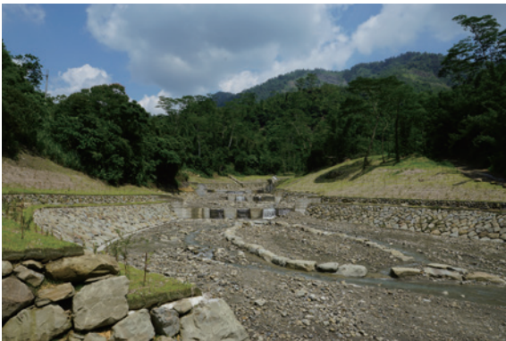
▲緩坡化護岸，供濱溪生物往來溪流。

2. 參考林務局「國有林生態工法之研究（95）」，為避免切割棲地及考量縱向生態廊道連結，設計連續性低矮化複式斷面固床工，除導正流心外，亦維持水域生物往上下游遷移、溯游，並利用溪床大小塊石，營造自然錯落之多孔隙環境，另保留部分河中大