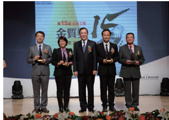
▲ 第15屆公共工程金質獎