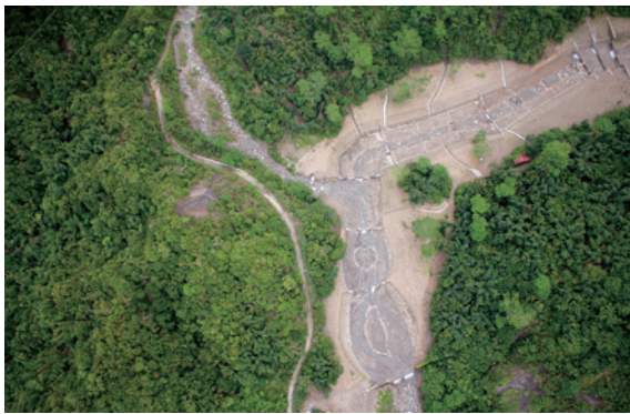
▲下游葫蘆型土砂緩衝區

3. 為有效控制土方清淤，於下游與水土保持局治理界點處，以砌石坡度變化使河岸曲線蜿蜒，採早期住民常用的葫蘆汲水器具飲水思源意象，設計葫蘆型土砂緩衝區，並以現地大型塊石為基石，排列愛心及臺灣圖像，淤滿基石即啟動土石清淤；左岸並採緩坡，可做為生物廊道，兼可提供未來沉砂清淤所需路線。