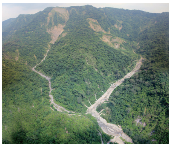
▲104年本工程完工後上游復育情形