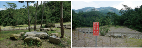
▲清淤塊石，設置停歇桌椅 ▲塊石桌椅，清淤塊石再利用。