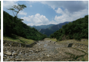
▲溪床緩坡化，利於生物溯游。