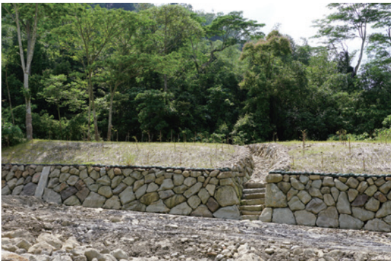
▲階梯式親水護岸，維持生態廊道。

1. 為確保橫向生態廊道暢通，於野溪左右兩岸各設置 2 條階梯式漿砌石溝，除作為橫向截排水外，亦供濱溪及兩棲生物往來溪流及陸域動物環境間覓食或飲水，另將下游砌石護岸緩坡化，提供動物便於橫跨兩岸，避免棲地破碎化。