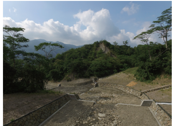
▲以溪中塊石，砌築護岸。