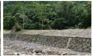
▲護岸孔隙，有利日後植物著生。