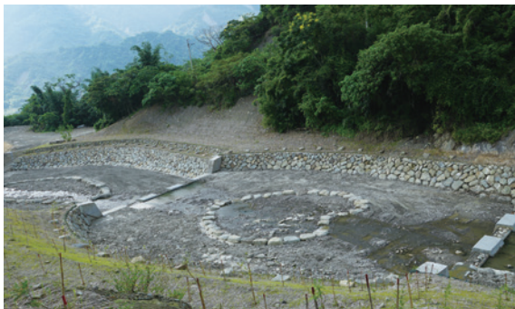
▲愛心及臺灣圖像，作為清淤基石。