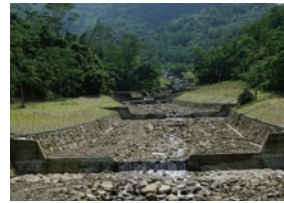
▲低矮固床工，確保縱向生態廊道。

石，以利水流激盪增加水中含氧量，並創造「深潭」、「淺瀨」、「急流」、「緩流」等多樣化生物棲息空間。