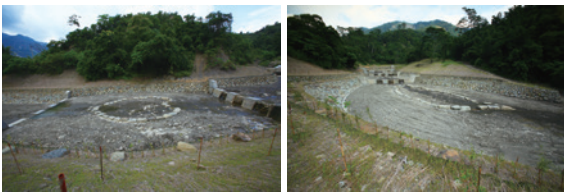
▲愛心圖案，活化清淤基石 ▲臺灣意象，調整流心流石。