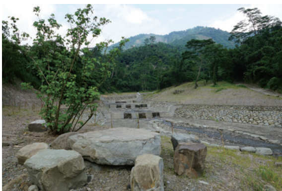
▲移植山芙蓉，維持倚生昆蟲蜜源。