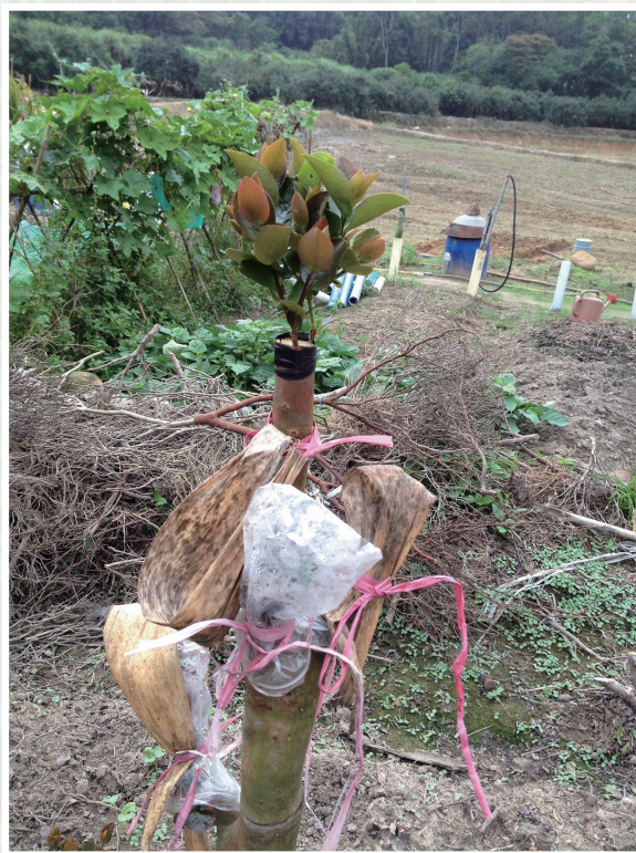
低產油茶樹嫁接豐產小果油茶品系之改良