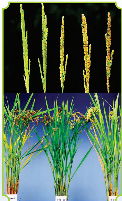
▲ 水稻新品種苗栗1號植株與父母本比較，及稻穗抽穗開花充實後穀粒顏色變化情形。