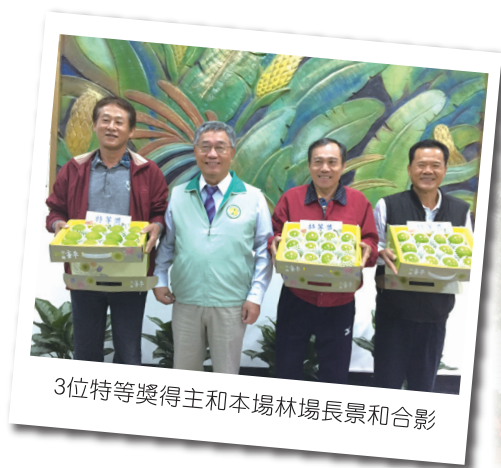
3位特等獎得主和本場林場長景和合影