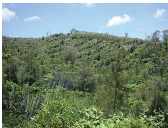
▲圖3、98年造林撫育期間（造林滿3年）

截至 105 年，造林地已有 5 年未再進行撫育措施，於 105 年利用空拍機重新檢視造林地，現在林相鬱閉，對照緊鄰未整治銀合歡入侵地之劣化單純林相，生態景觀截然不同（圖 3、圖 4）。