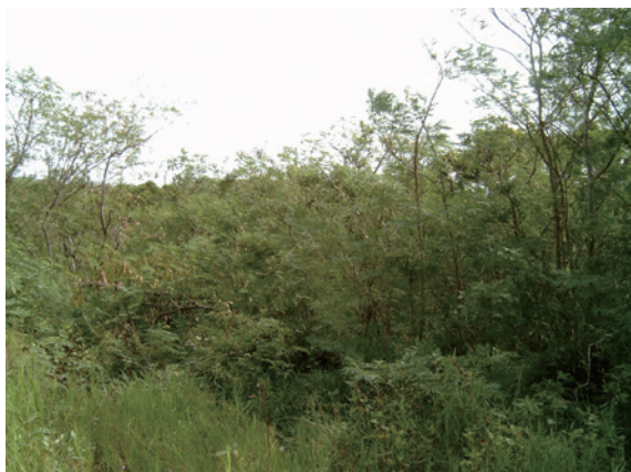
▲圖2、95年銀合歡整治復育造林前

面積 8 公頃之銀合歡純林（圖 2），屬農牧用地，採取全面整地，每公頃栽植 4,000 株之苗木（撫育至 100 年止）。