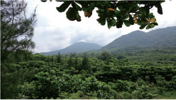
▲圖5、100年銀合歡整治復育造林地

成林（圖 5），102 年及 104 年尚在造林撫育期間，但成果已明顯可見（圖 6）。