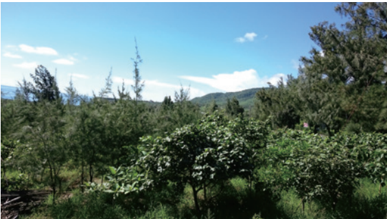
▲圖6、102年銀合歡整治復育造林地