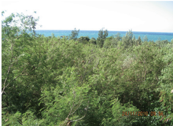
▲圖 1、林地銀合歡入侵形成純林