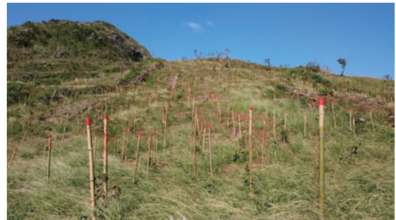
▲圖8、銀合歡移除復育造林執行中

以上，為確保執行成效，造林地銀合歡多以全面整地方式加以移除，如屬山坡地則考量水土保持因素，採留有保護帶方式處理，造林木在人工持續撫育得以成長下，但銀合歡小苗及砍除後之根株仍會不斷萌發覆蓋於林地上，須待造林木全面成林鬱閉，方能抑制銀合歡生長速度，平均成林時間約需 9 年以上。