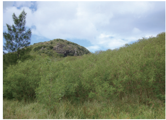
▲圖7、小尖山銀合歡造林前

造林地於 7 月新植完成，9 月 14 日即遭莫蘭蒂颱風 16 級強風破壞（於 11 月災害復育完成），現況每公頃造林苗木仍達 2,250 株以上，且草本植被已覆蓋林地（圖 8）。