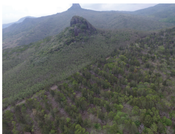
▲圖4、墾丁大尖山附近銀合歡純林，與相片右方整治復育造林地，形成強烈對比（105年）