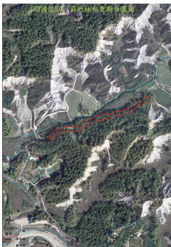
▲圖2、刺竹林相思更新位置圖