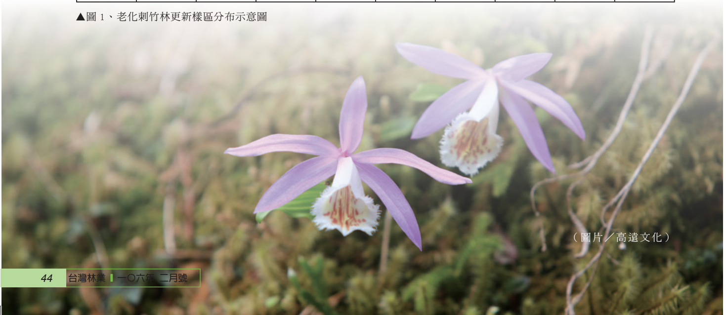
▲圖 1、老化刺竹林更新樣區分布示意圖