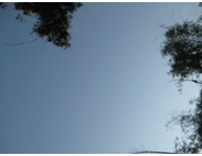
▲刺竹皆伐樣區之冠層