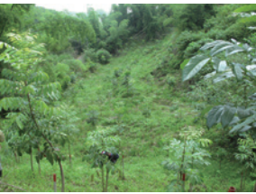
▲皆伐樣區桃花心木生長情形 (2016.5)