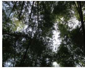
▲刺竹未伐樣區之冠層