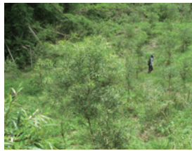
▲皆伐樣區相思樹生長情形 (2016.5)

本試驗地曾於2014年發生火災，亦曾崩塌，後續植生陸續進入，有機質堆積，改善造林地土質，且皆伐樣區受光充足，故栽植之桃花心木及相思樹初期生長快速，惟泥岩地土層仍較不穩定，2016年9月因梅姬颱風帶來強風豪雨，造成試驗地崩塌，無法持續觀測林木後續生長狀況。