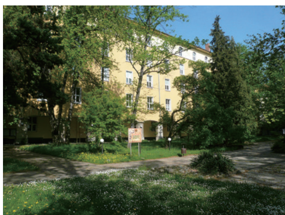
▲圖1、保加利亞林業大學校園

爾後歷經多次的整併及重組，學院規模越來越大，終於在 1995 年 7 月正式獨立，成為保加利亞最完整也是唯一的林業大學（圖 1），提供學士、碩士及博士學位。保加利亞林業大學目前設有 6 個學院，包括林學院、林產學院、生態及景觀學院、企管學院、獸醫學院及農藝學院等，共計 30 個系所。