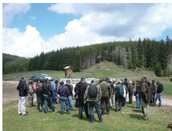
▲圖5、Yundola實驗林的導覽解說

為了推動集水區的長期觀測，1965 年時，該校特別於 Yundola 實驗林設立生態試驗站，為一完整的集水區，面積 321 公頃，海拔高介於 1,450 ~ 1,650 公尺間，林相為針葉混洩林，主要目的在於進行系統性研究，探討針葉林經營對集水區生態系之影響，如傘伐、疏伐及皆伐對土壤沖蝕及水量水質之衝擊，尤其著重於生態系統的水文歷程變化。生態試驗站內再細分許多小集水區，分別設立雨量站及流量站，建構水文資訊網，進行降雨量及逕流量觀測，每年 5 ~ 11 月溫度較高，水源大都以液體型態呈現，不過 11 月後至隔年 4 月間大都下雪冰凍，以固體型態居多，因此，液態及固態水源間的轉化機制是此生態試驗站的研究重點之一。目前該站已累積 50 年的水文基礎資料，包括水質、水量、泥沙及氣象等，提供長期生態研究之用，也培育許多優秀的碩博士生，此次生態試驗站參訪即是由該校兩位畢業博士負責導覽解說（圖 5）。Yundola 實驗林參訪結束前，主辦單位特地邀請所有與會來賓在園區內植樹紀念（圖 6），並頒發感謝狀給贊助單位。