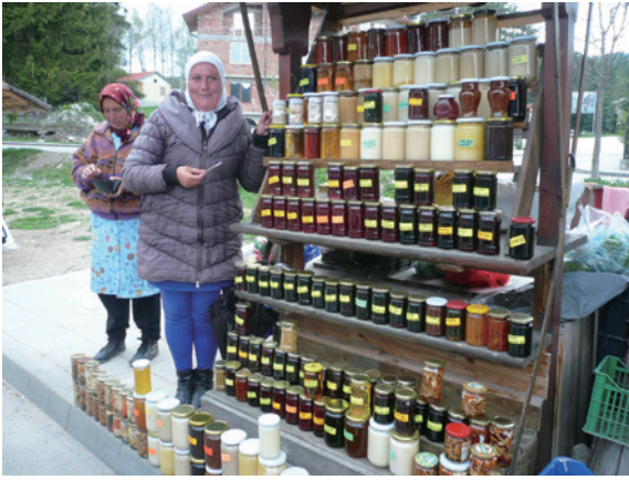
▲圖7、Yundola農民販售當地的果醬及蜂蜜