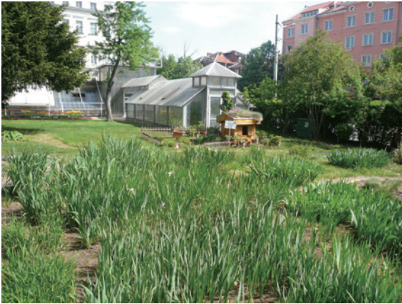
▲圖14、不同品系的鳶尾花及後方溫室