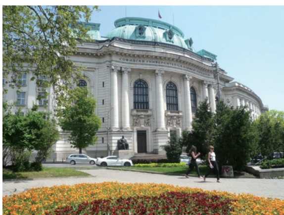
▲圖11、索菲亞大學校門口