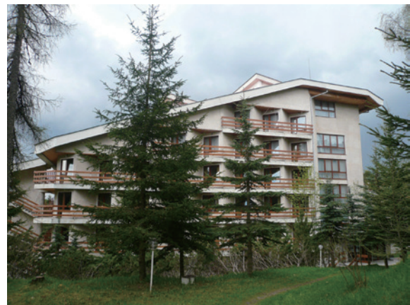
▲圖4、Yundola實驗林的學生宿舍

大會於研討會後安排一整天的野外實察，前往保加利亞林業大學的 Yundola 實驗林參觀。該實驗林自 1925 年設立以來，即提供學生實習及教師教學與研究之用，林區內海拔高介於 1,000 ~ 1,800 公尺間，平均海拔高 1,460 公尺，總面積為 5,191 公頃，其中 93.5% 為森林所覆蓋，採用多目標經營方式，進行森林地景保育及林木永續生產。區內植群主要為歐洲赤松（1,935 公頃），其次為挪威雲杉（1,428 公頃）及銀冷杉（1,268 公頃），至於闊葉樹櫟木則較少（166 公頃）。經森林資源調查得知，目前林木蓄積量共計 1,324,500 立方公尺，平均每公頃約為 273 立方公尺，年生長總量為 17,200 立方公尺，平均樹齡為 75 年，為當地典型的林木生長狀況。實驗林內設有學生宿舍、教室及辦公大樓（圖 4），提供學生實習之用，並設有許多不同的試驗小區，分別進行短期及長期試驗，且有 110 處永久的對照組小區，以探討不同的樹種、品系、作業方