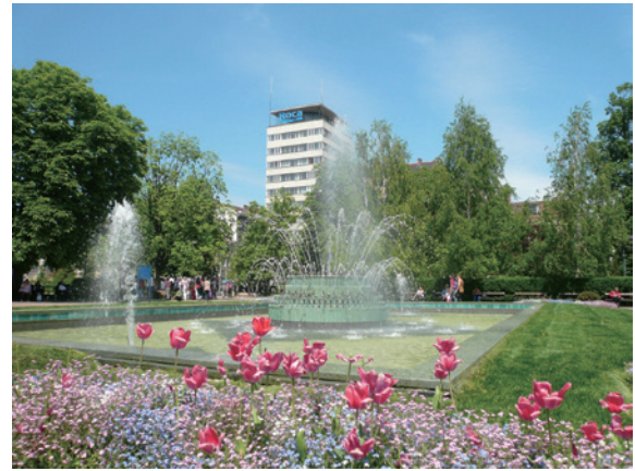
▲圖9、索菲亞市有許多公園綠地

館、美術館及音樂廳隨處可見（圖 10），深具東歐人文氣息。市區內的索菲亞大學創立於 1888 年，是保加利亞歷史最為悠久的大學（圖 11），目前有 16 個學院和 3 個獨立系所，約 25,000 名學生，索菲亞大學植物園與該校生物學院互動密切。