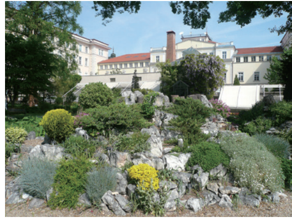
▲圖16、保加利亞特有種高山植物

Balchik 植物園創立於 1955 年，位於保加利亞東部，鄰近黑海，由曾任索菲亞大學校長的 Dr. Yordanov 教授規劃設計，占地 196 公頃，其中 61 公頃為公園用地，2005 年時另外闢建 11 公頃用地，特地為殘障人士所規劃。園區內設有地景公園，保留羅馬尼亞佔領保加利亞時期之皇宮建築花園景觀，以作為歷史文化古蹟。園區專門收集外來物種，目前擁有超過 4,600 種以上的不同植物，尤其是多肉植物和仙人掌的品系最為著名，超過 600 種以上，採戶外展覽方式，占地 1 公頃多，是繼摩納哥後歐洲第 2 個如此規劃的植物園。為了因應華盛頓公約之規範，保加利亞政府已將 Balchik 植物園作為收集該國珍稀瀕危物種的國家中心。