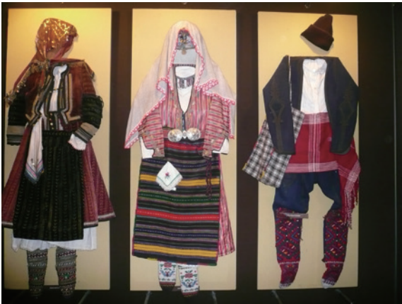
▲圖8、博物館展示保加利亞的傳統服飾