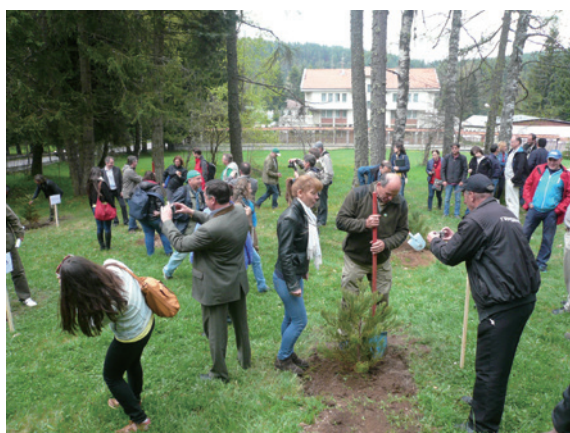
▲圖6、Yundola實驗林的植樹紀念

回程途中主辦單位特地安排與會人員參觀 Yundola 實驗林當地的農夫市集，由於鄰近森林，許多居民採集野果釀造果醬販售，並有許多蜂蜜及野菜，種類非常多樣（圖 7），為當地重要的森林副產物。此外，也參觀當地的文物博物館，是由保加利亞作家故居改建而成，部份空間保留作家起居室原始風貌外，另一側則作為展覽室，陳列當地傳統的食衣住行器具物品（圖 8）。