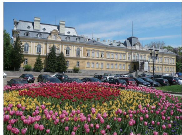
▲圖10、保加利亞國家美術館