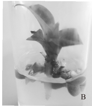
圖三 仙履蘭 Paphiopedilum Hung Sheng Red Apple (A) 及 Paph. Hung Sheng Magic (B) 雜交品系刺傷處理經二個月培養後芽體生長之情形。