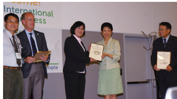
▲2013年6月24日林務局代表接受國際鳥盟頒發國際保育獎（陳彥伶提供）

國際鳥盟 2013 年 6 月 22 日在為期一週的世界代表大會，頒發國際保育獎 (Conservation Achievement Awards) 給中華民國行政院農業委員會林務局、台江國家公園以及臺南市政府，肯定中華民國政府在黑面琵鷺保育工作上的努力與成效。國際保育獎由「國際鳥盟」榮譽主席日本憲仁親王妃親自頒發，林務局、台江國家公園以及臺南市政府代表等 3 人上台領獎，駐加拿大代表劉志攻以及代表處同仁均在現場觀禮。