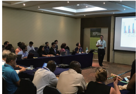
▲105年12月14日於墨西哥CBD COP13周邊會議，貝里斯FCD代表報告計畫成果。

保育、緋紅金剛鸚鵡保育計畫等成果，也吸引與會國際人士的熱情出席；另透過 IISD ENB 至現場報導，獲得極大篇幅之報導，除彰顯我國在生物多樣性保育的努力與成果，更可邀得國際或各國保育團體共襄盛舉，顯見國際保育捐助計畫有持續執行的必要。🌱