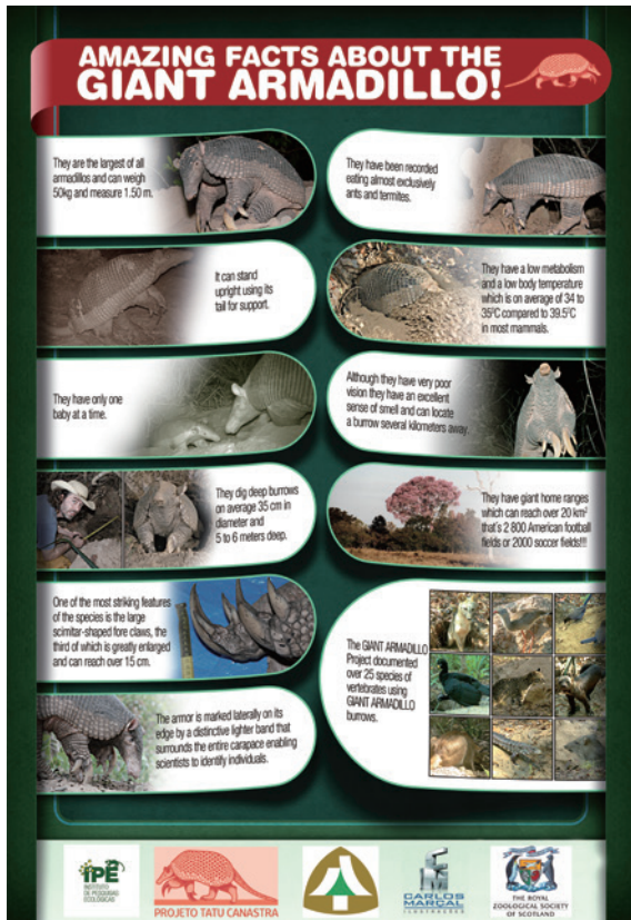
▲巴西大犰狳保育海報