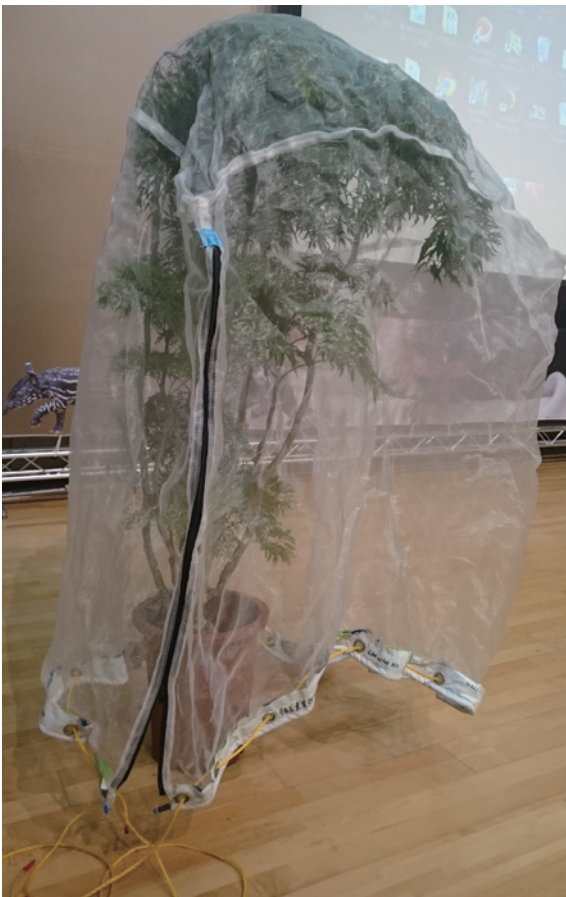
▲教學示範用防猴網

(9) 防猴網罩：防猴網罩主要採用 24 目白色塑膠紗網（透光率約 85%）為材料，縫製成立方體狀之網罩，規格尺寸為長 3.6 公尺 × 寬 3 公尺 × 高 3 公尺之網罩。防猴網罩操作簡便、成本低、安全無害，可有效防範獼猴、山豬、鳥類及鼠類等野生動物危害，又可防止果實蠅、蟪象及吸果夜蛾等害蟲，果實產量及品質均可維持良好的水準，無負面影響且保護效果佳，為一種友善生態之果樹猴害防範技術。