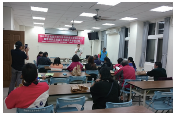
▲桃園市復興區宣導說明會