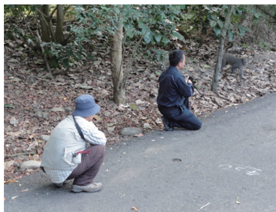
▲二水獼猴避孕藥劑注射