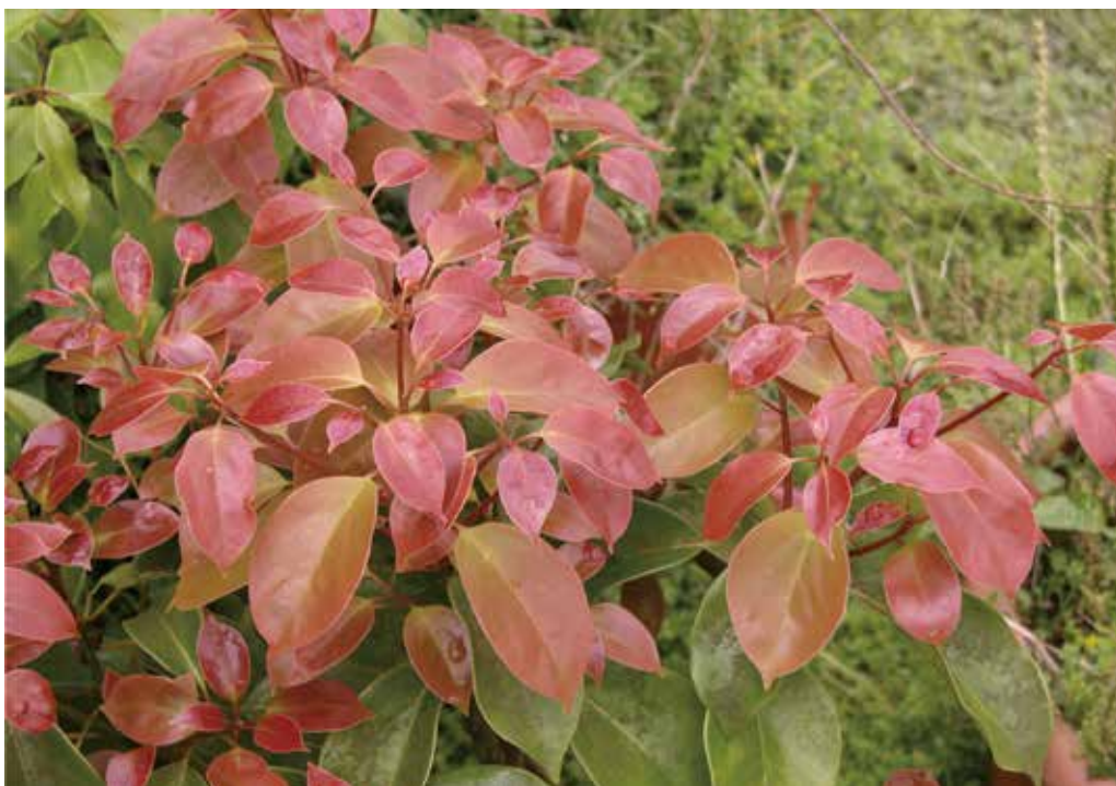
圖2 牛樟具有產業發展潛力