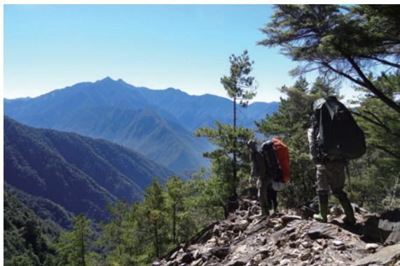
▲圖1、巡視員於高山地區執行深山特遣巡護工作

一般而言，海拔超過 8,000 英尺（2,440 公尺）即可稱作為高海拔地區，林務局轄管全國林地 160 餘萬公頃，以筆者服務的南投林區管理處為例，轄內埔里、巒大、丹大、濁水溪事業區大部分林地即位處高海拔地帶，不乏能高山、馬博拉斯山等名山大岳，第一線同仁活動於此區域執行深山林地巡護、不法案件取締、資源調查等工作，除了面臨崩塌、落石及蜂螫蛇咬等顯在危險外，往往因為任務需求，於短時間內急速上升海拔，暴露於高山症發作的潛在風險中而不自知，透過以下的介紹，期能讓本處同仁及讀者初步了解高山症的症候及預防，降低高海拔工作過程中因高山症發作而造成之危害。