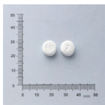
▲圖3、Acetazolamide外觀，榮民製藥

250mg 1天2次，口服，原適應症為青光眼，亦廣泛用於AMS之預防，可於上山前1天開始服用到山上工作的第3天，共吃4天8個劑量。但對磺胺類藥物過敏、蠶豆症、鎌型血球症、懷孕婦女（特別於懷孕前3個月）及已經知道對丹木斯過敏的患者不可使用。服藥期間可能有臉部、手腳指尖發麻或輕微感覺異常，排尿次數增加，為服藥之正常現象，停藥後即可恢復。