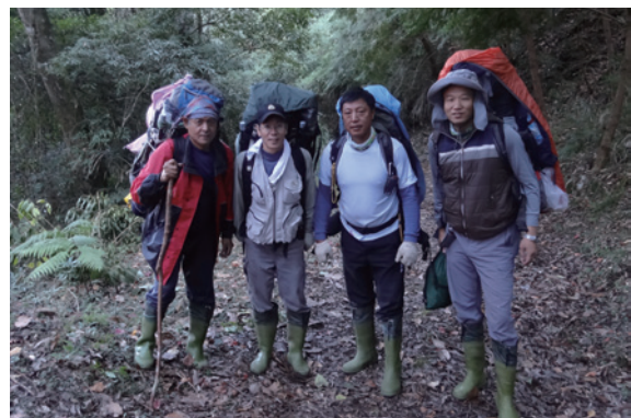
▲圖2、妥善行程規劃、漸進上升海拔高度可有效預防高山症發生。

高山症起因於人體對於低壓缺氧環境的適應不良，因此讓人體逐步適應氣壓及含氧量的變化，將可有效預防高山症的發生。由於臺灣山區藉由道路可及性高，加上任務安排等因素，同仁在執行各項深山工作時，常可於 1 天之內上升海拔高度至 2,500 公尺以上，因而暴露於高山病的威脅之下，因此在規劃高海拔地區的工作時，可透過合理的行程安排，採用漸進的方式上升高度來促進身體適應高海拔環境，降低高山症發作之風險；或是利用爬高睡低的規劃方式，即日間於高海拔地區執行工作，夜間則安排於較低海拔處宿營，因高山症常有延後發作的現象，透過爬高睡低方式，可在高山症尚未發作前回到較低海拔處宿營，達到預防之效果。