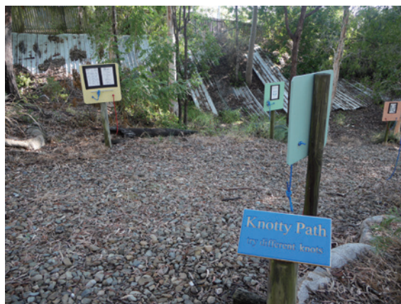
▲圖2、繩結步道透過解說牌，讓使用者自主學習繩結打法。

BIEEC 的課程方案配合昆士蘭教育局 (Education Queensland, EQ) 所制定的學科課綱，包括自然、生物、數學、語文等科目，藉以吸引學校老師帶學生至中心進行戶外教學，讓學生與學校所學對照，強化學習效果，這與林務局自然教育中心運用的市場策略類似，透過提供符合客戶需求之課程以吸引客戶；而若參加 BIEEC 戶外教學的對象是鄰近社區的學校學生，會由家長將學生送到中心，與學校老師會合再進行課程，與臺灣戶外教學由學生到學校集合後，再與學校老師統一搭車前往戶外教學地點的方式很不同。