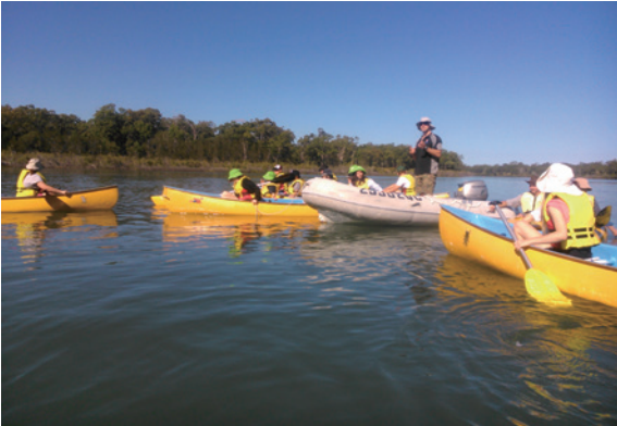
▲圖3、學生划獨木舟觀察Boyne River出海口一帶的紅樹林

同下，搭船到離島進行浮潛，觀察珊瑚礁，更甚者到大堡礁一帶露營，進行1週的海洋生態課程。這種到中心以外的場域進行課程，對於東眼山而言，是相當不同的操作方式。