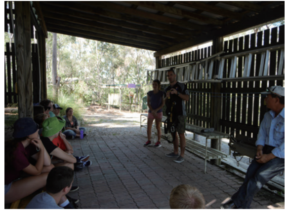
▲圖9、在進行高空探索活動前，BIEEC教師介紹護具的穿戴方式，並為學生進行心理建設。

這群高中生一個個在尖叫與為彼此的鼓勵中完成個人的高空探索挑戰，展現出帶有成就感的滿足表情。這反映教學者在教學過程中，應該關注的不單只是學習者的生理安全，也包括了心理安全。