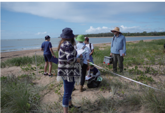
▲圖5、學生在Boyne River出海口沙丘進行穿越線調查，瞭解當地植被分布與生長情況。