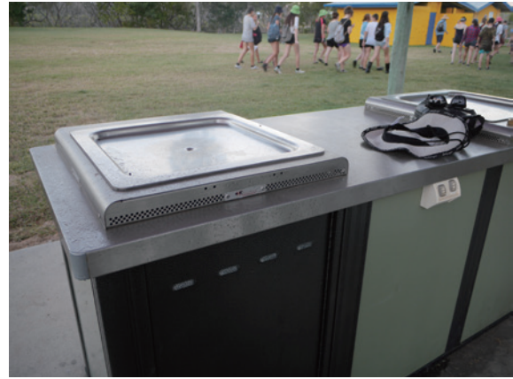
▲圖6、公園裡的烤肉爐顯示了澳洲人對於戶外遊憩活動的熱愛與重視。

在BIEEC停留期間，筆者也發現Boyne River沿岸有鋪設完善的步道可供社區居民散步、慢跑與騎自行車活動；公園裡有免費的電力烤肉爐與盥洗設備；鄰近社區居民家家戶戶有私家船或露營車，不難看出戶外遊憩活動對於澳洲人而言，早已經是生活文化。而戶外教學最讓課程提供單位與帶領學生戶外教學的學校教師在意的，除課程方案的品質外，想當然爾就是「安全」，BIEEC又是怎麼確保人員的安全呢？