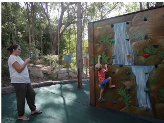
▲圖1、戶外攀岩牆提供使用者視個人狀況進行不同程度的自我挑戰

艾爾岩或打工渡假外，可能所知不多，而澳洲昆士蘭省東南方的波伊恩島環境教育中心，位於接近 Boyne River 出海口的河畔位置，臨近 Boyne Island 跟 Tannum Sands 社區，距離格拉斯通 (Gladstone) 這個工業城市約 20 分鐘的路程，而鄰近的海岸線，正是澳洲聞名世界的大堡礁 (The Great Barrier Reef) 保護區範圍。占地 2 公頃的中心，沿用遷址後社區小學所留下的硬體設施，並陸續增加包括辦公室、教室、廚房、餐廳、住宿設備、野炊場地、高低空探索 1 設施、攀岩牆等設施，還有不同主題的步道提供如科普知識或繩結等自導式主題學習，可說是麻雀雖小，五臟俱全。