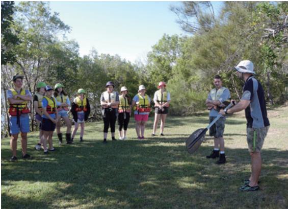
▲圖8、BIEEC教師在划獨木舟課程前，讓學生穿著救生衣，並向學生說明正確的操槳方式與安全注意事項。

BIEEC 的教師在課程前，除告訴學生課程內容外，也特別提醒學生在活動中要記得照顧自己、同學與環境，讓學生除關切環境之外，也注意自己與同儕的安全。即便戶外活動對於澳洲人來說，早就是家常便飯與基本技能，但筆者觀察到，在操作獨木舟、浮潛或高低空探索等活動前，教師會在課程前說明器材使用方式、安全規範與注意事項，並替學生做好心理建設。