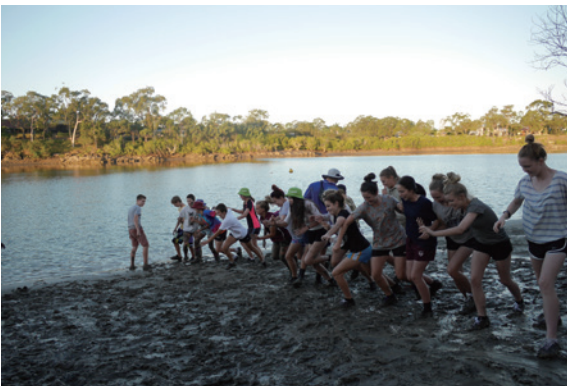
▲圖4、踏入灘地觀察紅樹林的學生，在觀察課程結束後進行泥巴仗。