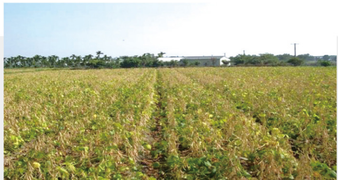
圖3. 落葉性佳品種為育種目標