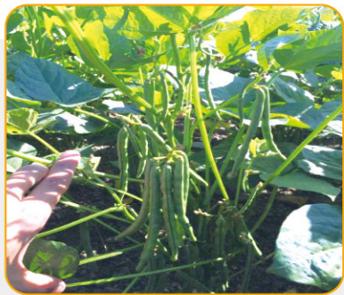
圖2. 優良品種與產業息息相關

此外，優良品種(圖2)是維繫產業永續發展關鍵，本場對紅豆未來的育種方向有三大規劃，近程目標為氣候變遷下的因應，栽培管理技術再進化精進，目的在建立紅豆「生理指標」強化生長栽培模式，以簡化栽培管理作業與避免不良環境，病蟲害適期防治，達到肥培管理精準化，並藉此評估判斷成熟期或收穫適期，育種上可應用調整開花期，產業上可應用生產優質種子。其次為育種目標的全程規劃，推測紅豆植株在葉型與調控開花的基因表現對「光」因子具有連鎖效應，雜交選育上可優先評估導入，預期優勢可避免造成提早開花、生長勢軟弱、葉片與植株徒長等現象，減低栽培期氣候環境因子的負面影響，期望在所謂的「落葉性佳」(圖3)的特性，可利用此育種技術選育達標，減少未來在採收期乾燥劑的使用。最後則為創新品種，除了維持本場一直以來的紅豆育種目標：特大粒型、種皮鮮紅、品質佳、高產、落葉性佳及農藝特性佳，適合於機械化栽培的方向選育品種，亦朝創新的獨特性品種方向規劃，以因應多元化豆類時代來臨。