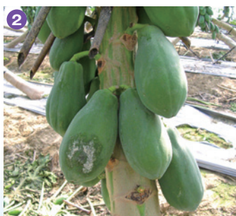
③紅龍果果腐病病徵(真菌性)