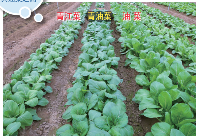
青江菜 青油菜 油菜