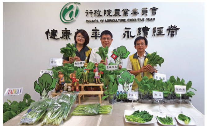
↑6月26日在農委會辦理青油菜新品種發表會，向媒體說明品種特色與優點