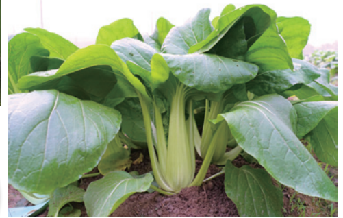
青油菜外型介於青江菜與油菜之間