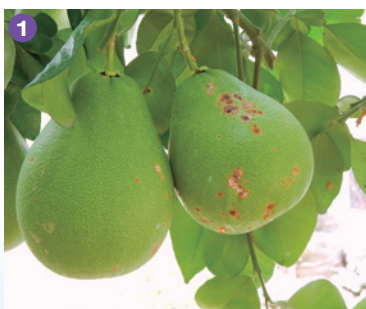
①文旦潰瘍果實病(細菌性) ②木瓜果疫病病徵(疫病菌)

疫病菌藉由雨水飛濺傳播而感染，大風大雨易造成果實傷口，加上雨天環境中濕度高，利於病原菌侵染及繁殖而造成果實腐爛。其它藉雨水傳播的真菌性病病害包括炭疽病、蒂腐病、果腐病等。細菌性病害更是容易藉由雨水散播，例如蔬果類的細菌性斑點病、軟腐病、果斑病、果樹上的細菌性潰瘍病、斑點病、水稻上的白葉枯病等，均可藉由雨水而快速蔓延。