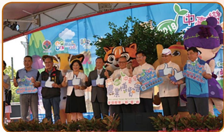
▲ 與會佳賓共同為2018中臺灣農業博覽會揭開序幕

「中臺灣農業博覽會」為中部四縣市聯合舉辦的年度大型農業推廣活動，以宣導農業特色、農村文化，進一步促進農村休閒觀光的效益，由苗栗縣、臺中市、南投縣及彰化縣四縣市輪流辦理，今年輪由苗栗縣主辦，以「幸福農業新時尚的創新思維」為主軸，設有幸福苗栗館、品味南投館、彰化優鮮館、花現臺中館、農業成果展示