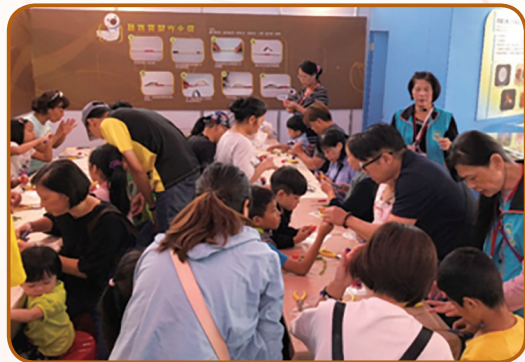
▲ 蠶繭花DIY區座無虛席，親子聚精會神共同完成作品，場面溫馨感人