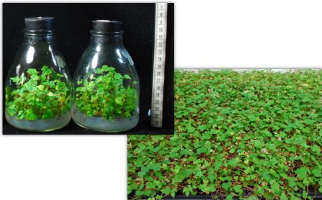
種苗改良繁殖場生產之小葉葡萄組織培養苗及穴盤苗。