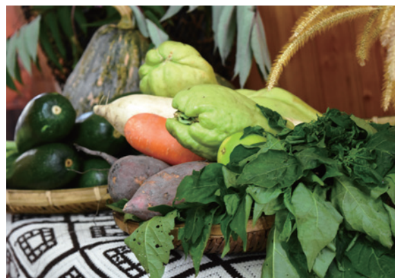
食物零里程的新鮮食材。