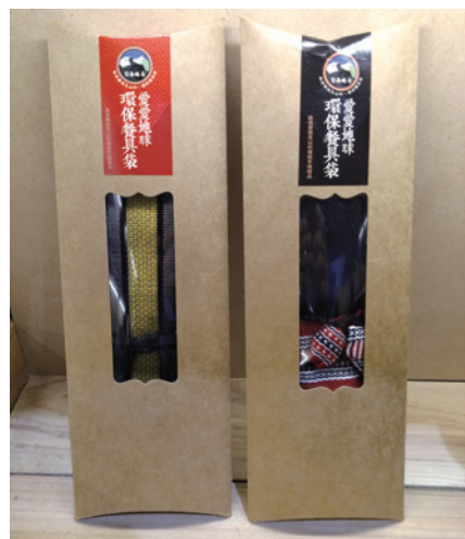
賽德克手作一環保餐具袋。