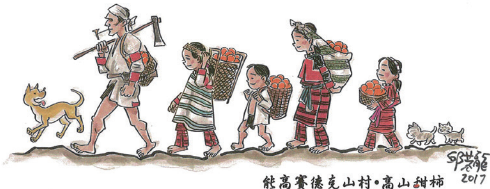
高山甜柿插畫卡。(繪圖/邱若龍)

三村六部落多數人口以全職或兼職方式從事農作生產，故農產品之市場價值及產銷方式影響部落經濟，而自發展綠色經濟之思維觀之，農業生產所用農法，亦應契合對環境友善之基