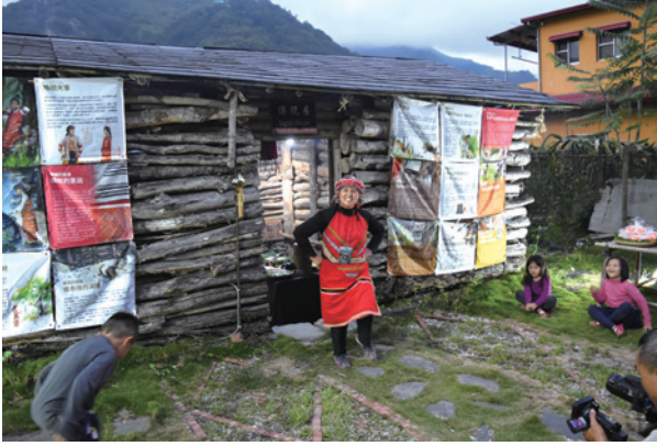
都達部落於傳統屋簷前迎賓歌謠。