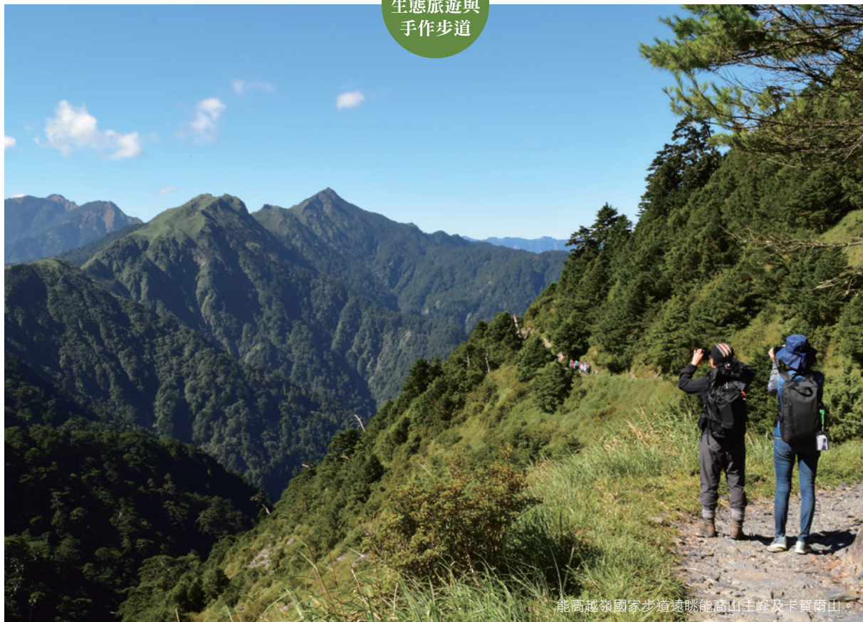
能高越嶺國家步道遠眺能高山主峰及卡賓兩山。