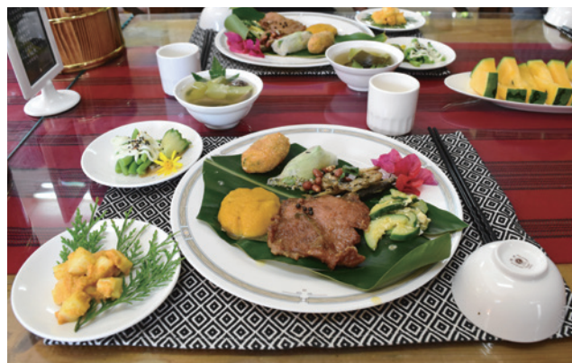
春陽部落廚房「風味餐」。

完整遊程所需之人力來源跨越三村六部落，人力調度運用複雜度高。欲成就一次生態旅遊遊程，涉及遊程規劃與安排、服勤人員的排班、協調及登錄、對外的聯繫與接洽、環境巡護工作之提倡與落實、遊程經費與回饋基金計算、發放、活動成果紀錄與追蹤等，各環節之工作缺一不可，勢必需有專責人員統籌協調，