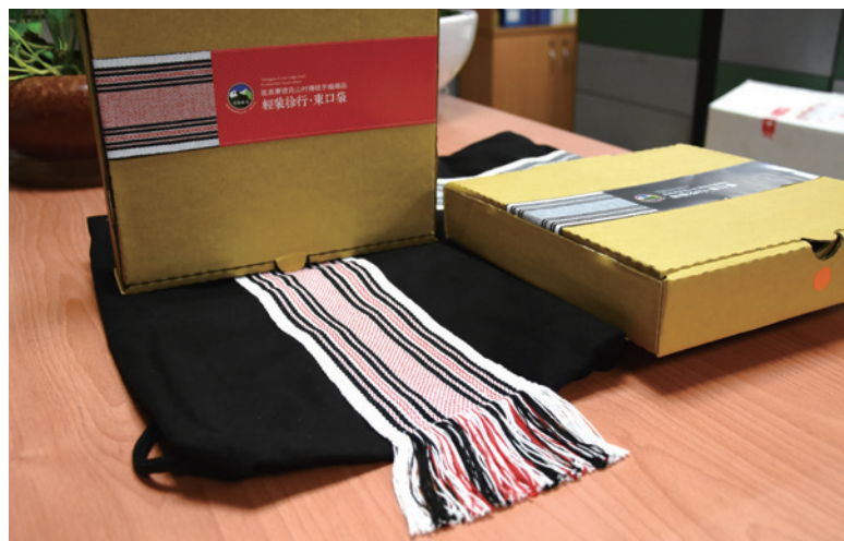
賽德克手作一束口袋。

三村六部落從國家步道之生態旅遊輔導計畫出發，再結合山村發展計畫；從接受外部專業團隊之輔導帶領，再轉進回推自身組織之演練操作，二者之結合，對於林務局而言，除可發展具深度、廣度之臺灣山林環境體驗，讓國內外遊感受臺灣之美外，當地部落則在友善環境