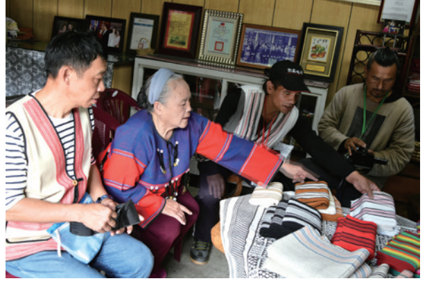
遊程—賽德克族編織及音樂饗宴。

入高齡化社會。既有產業狀況，農業為南投縣仁愛鄉之基礎產業，並以原住民保留地為主要使用土地；主要農作大致分為果樹、蔬菜、稻米、茶葉及咖啡等，惟據仁愛鄉農會表示，原住民保留地之耕作礙於經濟現實，部分陡坡面臨不當開墾壓力，故實務上欠缺各類農作之全面性面積及產量調查。如以三村六部落範圍內二處果菜運銷合作社，含南投縣仁愛鄉高冷蔬果生產合作社及南投縣仁愛鄉原住民果菜運銷合作社之產銷紀錄分析，近3年（2014-2016）期間，蔬果類之敏豆、高麗菜、青椒、菠菜、南瓜及甜柿等，為經年產銷之大宗。