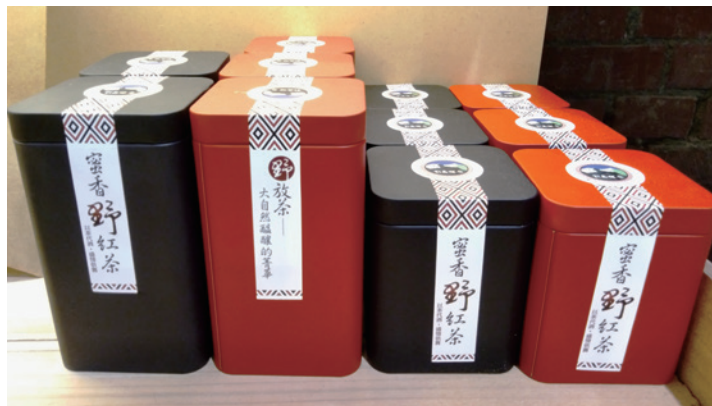
野放茶及蜜香野紅茶。

本價值。本分項工作初期以「食安」為目標，鼓勵部落農戶採取安全用藥的方式生產農作，期改變部落的耕作習慣，兼顧部落農產與保育，俾建立轉型友善耕作之基礎，推展在地潛力農特產品，提升里山農業價值。