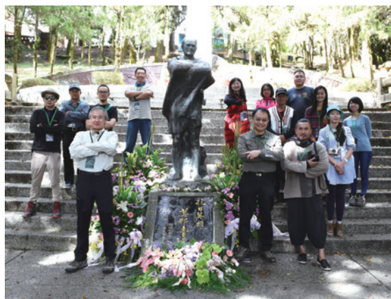
遊程景點—霧社事件紀念公園。

賽德克族為環繞能高越嶺道群山居住之主要民族，於2008年4月23日經行政院原住民族委員會認定為臺灣原住民第14族，含德固達雅