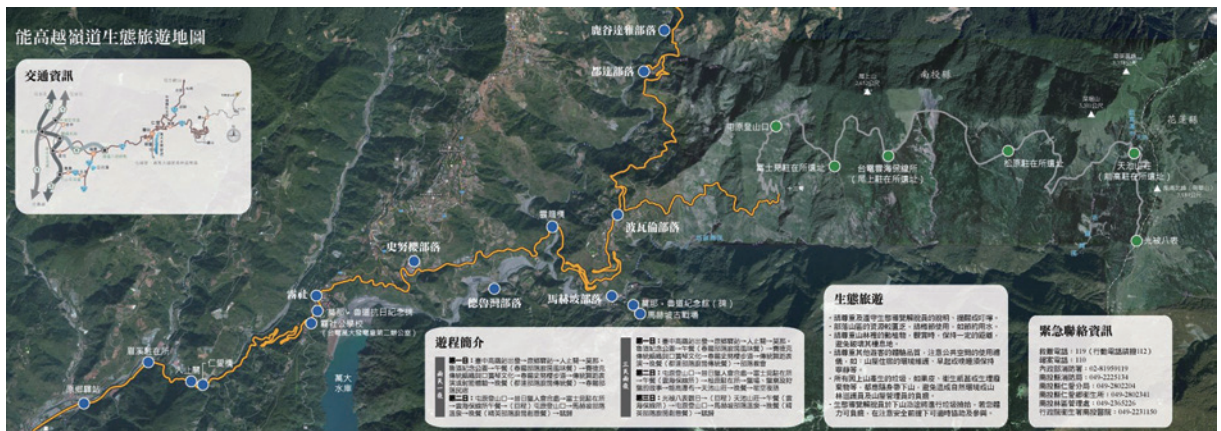
能高越嶺國家步道生態旅遊地圖。

因能高山具有與「新高山」（玉山）、「次高山」（雪山）齊名之高知名度，且因能高越嶺道易行、景佳，故於1933-1940年間，成為全臺最熱門的中央山脈越嶺路線；另外，因為木瓜溪流域之水力發電豐沛，能高越嶺道也被進一步利用於東西向輸電計畫之規劃，然終因二次世界大戰戰情慘烈而中斷，之後即便臺灣光復，仍因戰後初期財政窘困而荒廢傾頹。嗣1950年韓戰爆發，美國政府編列專款，重建日