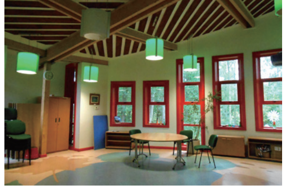
圖4、畢夏木田野中心其中一間木造風格教室。

府教育局主導與施作。畢夏木田野中心2016年4月加入FSC，同時是FSC其中一個自然教育中心，也是國家配電公司環境教育聯盟其中的成員，像這樣在英國有和電廠有合作關係的教育中心有4個。畢夏木田野中心面積佔地70公頃，擁有較古老及新生的森林環境、水池等棲地，該範圍主要以推動教育為目的，在經營管理與場域維護上，電廠每年贊助2萬英鎊給中心作為營運資金，也贊助6萬英鎊作為中心場域維護的預算，雙方亦簽訂「永續維護計畫」共同進行場域維護，在分工上，中心負責建物內部維護，電廠負責建物以外的修繕（圖3）。