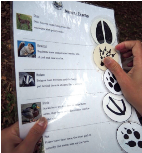
圖6、探索動物足跡學習單。