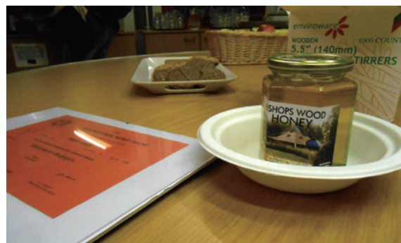
圖2、畢夏木田野中心與合作蜂農所產的森林蜜。

畢夏木田野中心在1994年由當地政府教育局和國家配電公司 (National Grid) 共同成立與營運，國家配電公司為中心建物與土地之財產所有權人，而所有建物的設計與規劃由地方政