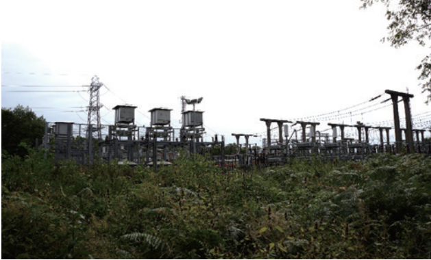
圖3、國家配電公司所屬的配電場即位於中心旁（National Grid）。