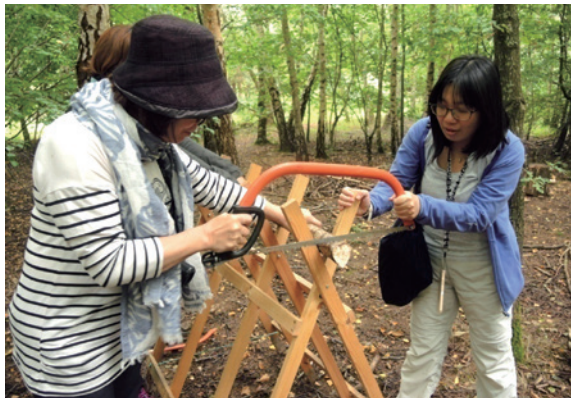
圖9、木工體驗。