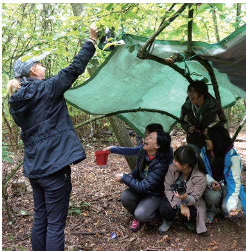
圖8、教師利用灑水器測試是否牢固(右下)。