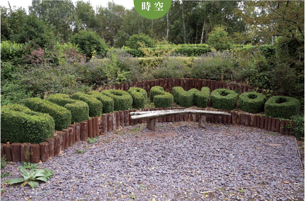
畢夏木田野中心 (Bishops Wood Field Centre) 入口意象。(攝影 / 高曼菁)