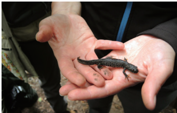
圖11、教師發現之蝶螈向學員說明。