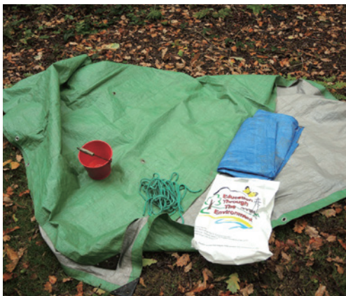
圖7、使用之器材(右上)。