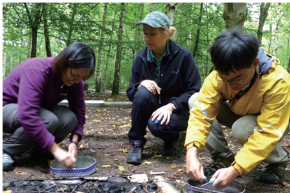
圖10、打火石體驗。