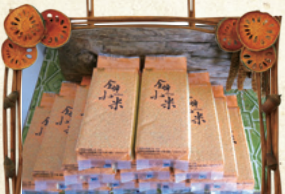
» 金峰產銷班的小米真空包產品