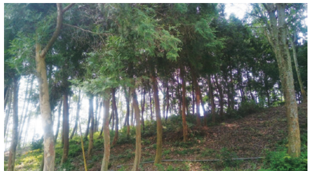
臺灣肖楠人工林，經適當的造林撫育作業，於造林8年後林地已接近鬱閉狀況，若以現行單一標準獎造辦法標準，無法調整撫育作業，限制林業經營之靈活性。