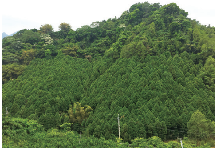
臺灣肖楠造林地遠景，臺灣山坡地林業特色為小面積林主眾多，需整合作業規劃與促進集團式經營方能降低造林與收穫成本。

考量「獎勵輔導造林辦法」精神係獎勵造林者之造林行為，而非特定族群對象，故接續以產業輔導計畫，地方可建置地區林業特色發展規劃，展現木材應用、藝術等傳統習俗，提升國產材應用之效益面向。由地方輔導造林者種植指定樹種、輔導發展多元化林業經濟。未來將持續與各地方政府協調，共同規劃適合各地區產業特性之相關輔導計畫，打造地方林業特色。