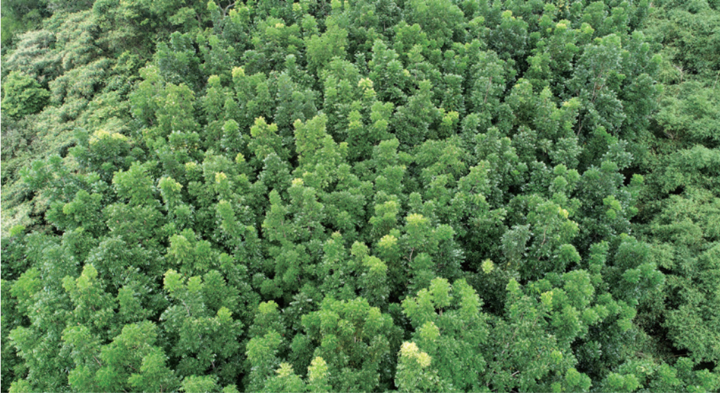
臺灣中部地區造林地一景，目前UAV空拍機已逐漸應用在造林檢測方法上。