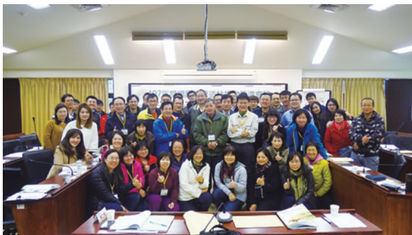
配合「森林永續經營暨產業振興計畫」及「國產材生產規劃與市場開拓」政策，集結造林業務承辦策進會議，共思獎造辦法制度優化。

1%，為林業資源永續利用，避免未來國際貿易管制衝擊，減少運輸碳里程，本土人工林木材資源之合理利用必須啟動。然現行公私有林經營不易，造林初期成本高，造林人經營意願低，以致森林荒廢，不利國土保安、水源涵養。為促使公私有林永續經營，經檢討後仍有必要由政府補助支持造林、撫育及管理成本，以營造優質森林，帶動林產業振興，逐步建立產業鏈，活絡國內林產業，提高國內木材自給率。林務局目前已通過疏伐作業、生產設備及各項認證補助，以達成兼顧森林環境保育與林業經濟發展等效益。