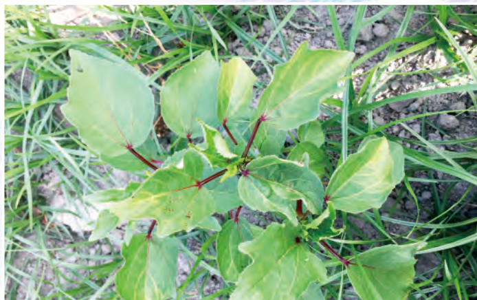
圖5. 洛神葵葉緣出現黃化現象後即應進行防治