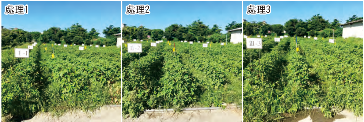
圖3. 不同防治時機洛神葵播種後8週生長情形。處理1(第3次施藥前)：葉緣黃化後開始每2週施藥1次；處理2：對照不施藥；處理3(第1次施藥前)：依監測蟲數連續2-3週蟲數以1.5-2倍上升開始每週施藥1次。