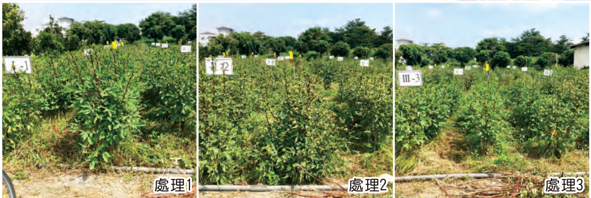
圖4. 不同防治時機洛神葵花苞期田間生長情形。處理1(第5次施藥前)：葉緣黃化後開始每2週施藥1次；處理2：對照不施藥；處理3(第5次施藥前)：依監測蟲數連續2-3週蟲數以1.5-2倍上升開始每週施藥1次。