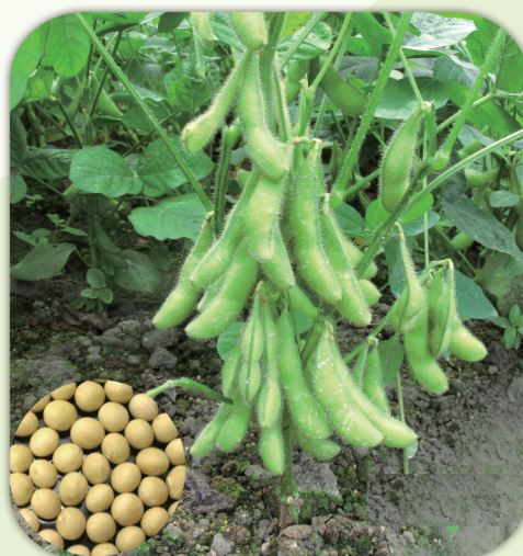
高產優質的毛豆高雄9號(左)食味品質佳，是目前的主力品種。