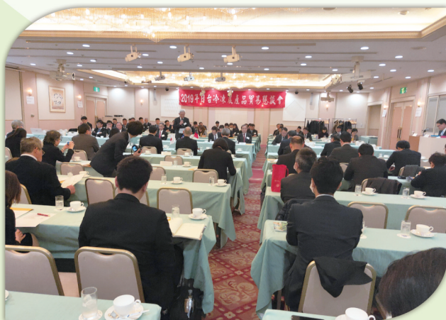
農委會每年均輔導臺灣區冷凍蔬果公會及毛豆加工業者進軍「日本東京國際食品展」，並召開「日臺冷凍農產品貿易懇談會」，積極爭取外銷訂單。