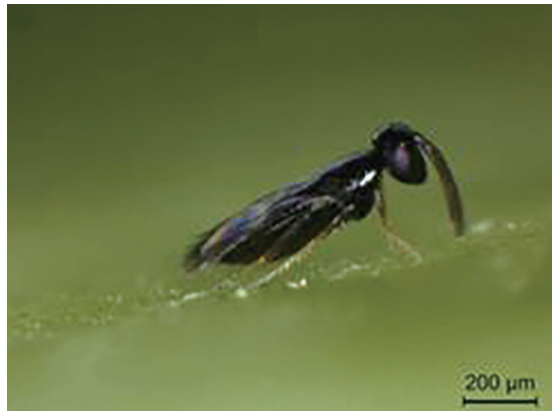
Female of Entedononecremnus sp.