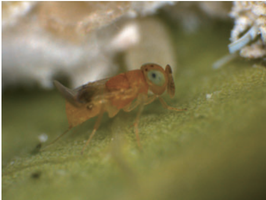
Female of Acerophagus papaya Noyes and Schauff