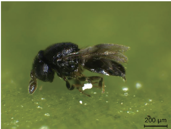
Female of Chartocerus walkeri Hayat