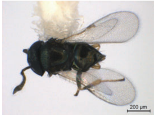
Female of Pseudleptomastix sp.