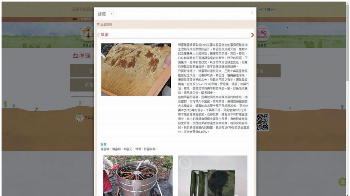
圖五、生產技術中蜂蜜生產方式介紹。