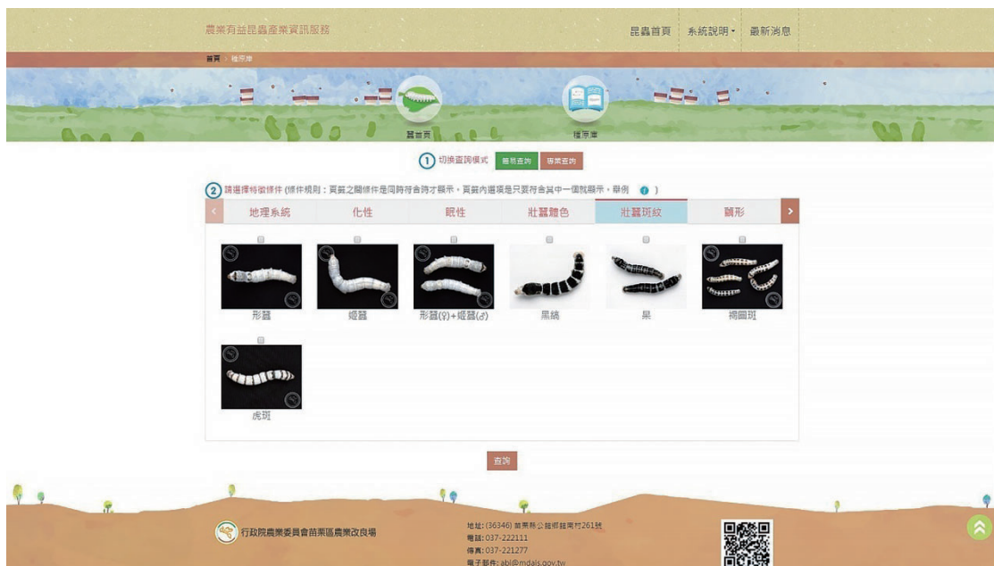
圖七、家蠶種原庫查詢畫面。