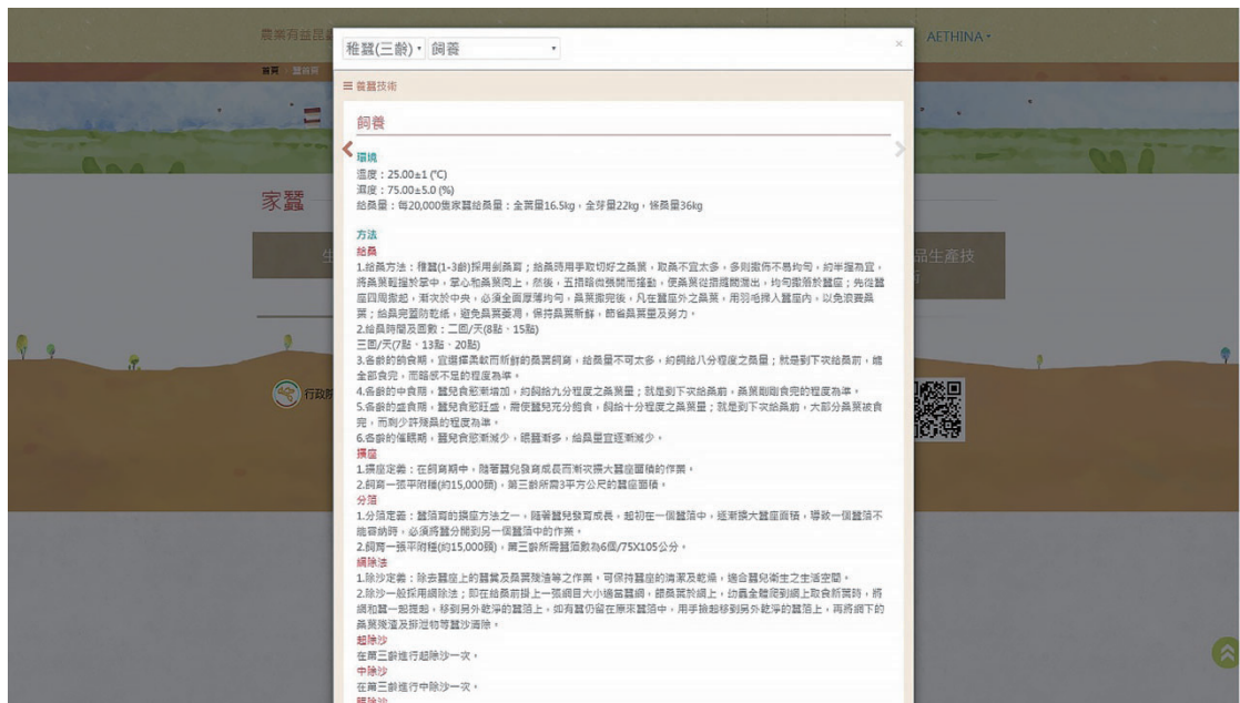
圖三、養蠶技術中三齡稚蠶飼養方式介紹。