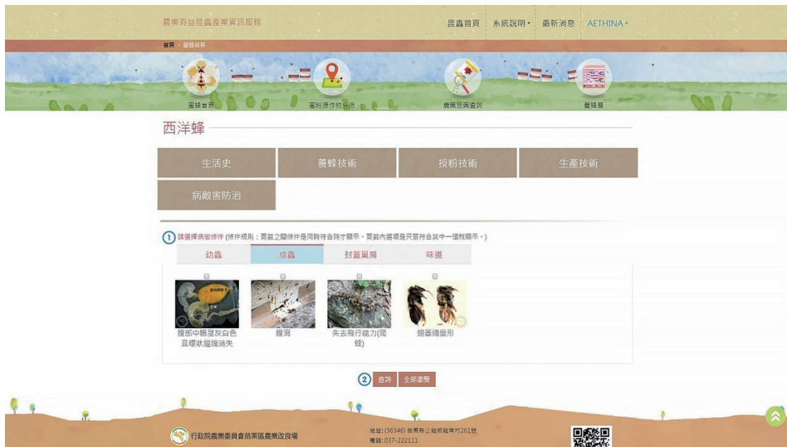
圖六、蜜蜂病敵害防治查詢畫面。