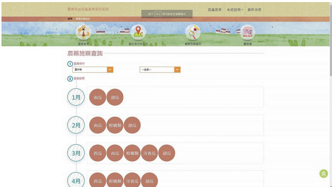
圖九、農藥施藥查詢畫面。