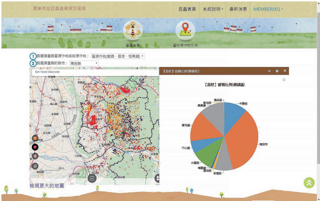
圖八、蜜粉源作物分布查詢畫面。