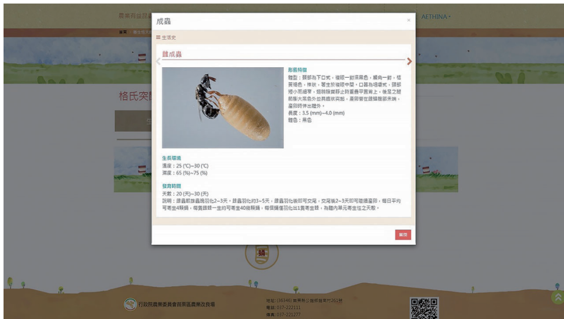
圖二、天敵昆蟲格氏突闊小蜂雌成蟲的詳細介紹。