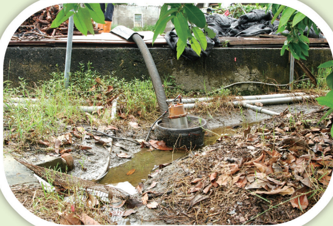
必要時以抽水馬達排除田區積水