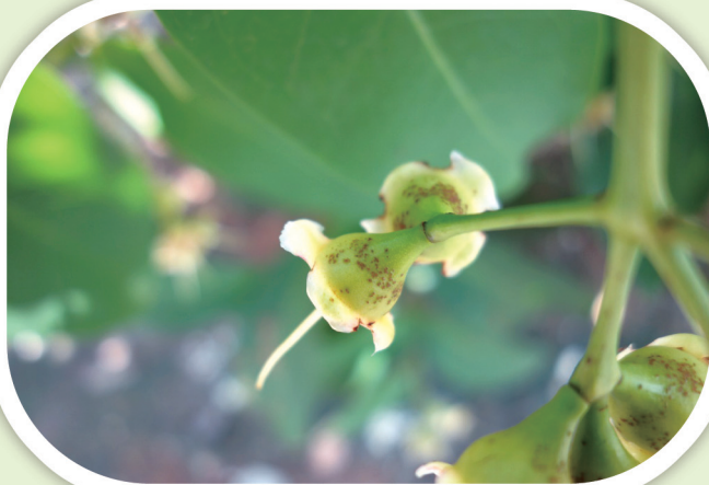
降雨前後加強鈣、硼補充及防治病害。