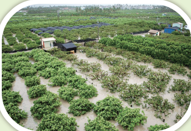
低窪地區蓮霧園雨後常積水數日

積水田區不宜灑施肥料，宜先改以葉面施肥。 待新梢重新生長時，可再由地面施肥供應。