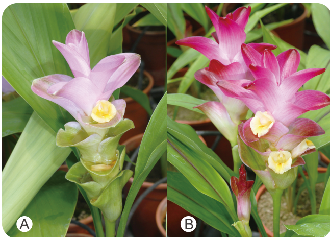
圖1. 薑荷花新品種「高雄1號－粉鑽」(A)及「高雄2號－胭脂」(B)。

薑荷花是薑科薑黃屬的觀賞植物，花形特殊、顏色豐富多樣，且觀賞期長、又能耐受高溫，是炎炎夏日裡少有的絢爛花卉。培育新的薑荷花品種、擴增品種的多樣性一直是本場努力的目標，自民國97年起開始進行種原蒐集及雜交育種工作，經過多年努力及多次選拔評估，由近千株雜交後代植株中，選出數個花形及花色新穎亮麗，具有產業運用潛力的盆花及切花用品系。其中，率先推出2個新品種「高雄1號－粉鑽」及「高雄2號－胭脂」（圖1）取得品種權，並已完成非專屬授權移轉業界利用。後續仍有多個優良品系尚在評估中，將可為薑荷花產業提供多樣化的選擇。