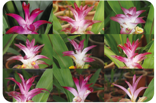
圖3. 黃色花品系的苞片樣態

由於有商業切花品種的加入做為親本，在所得到的紫色花品系中，苞片顏色及型態的表現較黃色花品系為多樣；苞片顏色分為白色系及粉紅色系(圖5)，同一色系除了主色外還有副色，另外在苞片上或多或少都有不同顏色的斑紋，上半部是主要呈色苞片，通常會有綠色或褐色的斑紋，下半部苞片主要顏色為綠色，有些品系會帶有紅褐色的斑紋、或紅色的斑塊，光是著色程度就有很豐富的變化。薑荷花之所以稱為薑荷花，是由於最早引進臺灣的品種在花形花色上都像極了荷花，目前也有多個新品系頗有荷花的姿態。