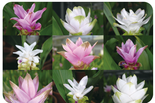
圖5. 紫色花品系的苞片樣態